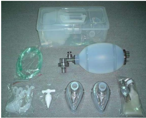
圖一 攜帶式人工甦醒器