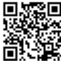
孕婦產檢增值手冊

國民健康署編製「孕婦產檢增值手冊」，提供準媽咪更多的衛教資訊，記得跟您產檢的醫療院所領取，亦可至國民健康署健康九九網站下載。