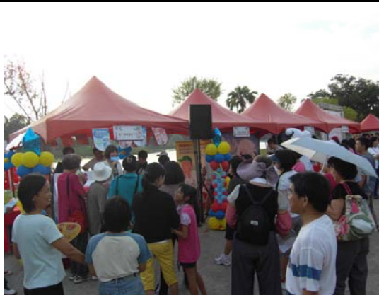
「健骨路力行」：健行闖關活動