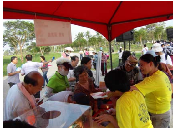
民眾至更年期衛教攤位諮詢相關議題