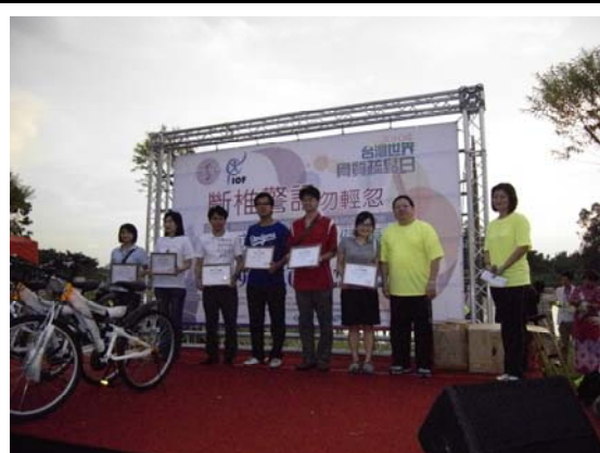
台灣世界骨質疏鬆日健骨路力行頒獎