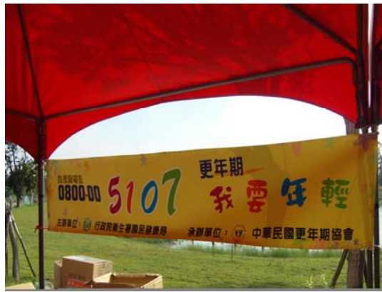
活動會場 0800 更年期諮詢專線宣傳