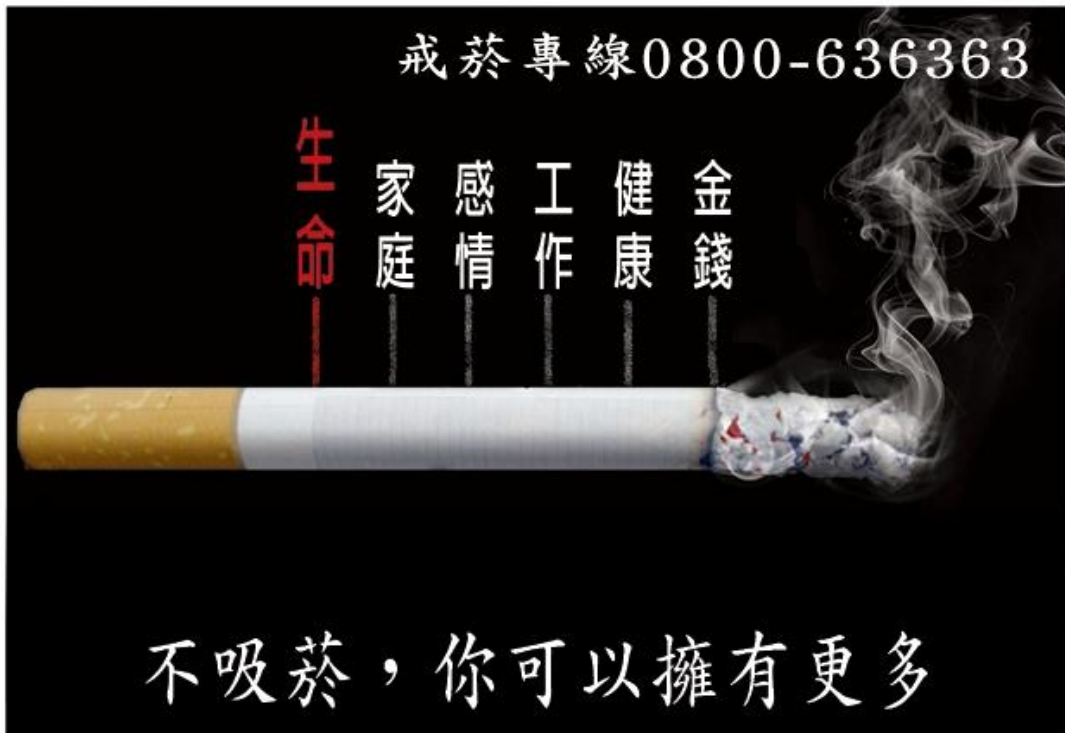
圖3、不吸菸，你可以擁有更多