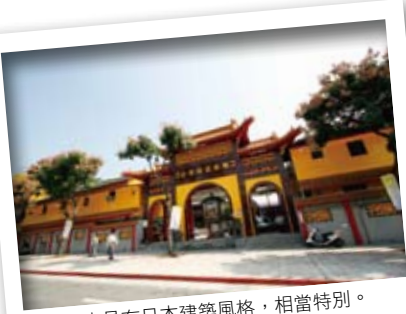
護國禪寺具有日本建築風格，相當特別。

搭乘捷運淡水線從圓山站下車，即可步行到一般人很少注意到的「臨濟護國禪寺」，有著日本江戶時期風格的山門與一旁的寺廟門坊並立，顯得有些特別，護國禪寺據說是日治時期，由日本僧人得庵玄秀禪師受台灣總督兒玉源太郎之邀來台弘法所建，是台灣唯一冠以「護國」之名的佛寺；走入重修後的大殿，屋頂的黑瓦、瓦當跟鬼瓦採用名古屋製作的瓦片，復舊