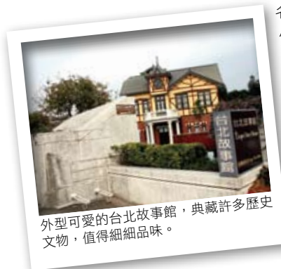
外型可愛的台北故事館，典藏許多歷史文物，值得細細品味。

走累了，再到一旁有著鵝黃色、宛如童話故事書裡建築的台北故事館喝杯下午茶，具有英國都鐸式建築風格的台北故事館，曾是大稻埕茶商用來招待政商名流之用，如今館內仍展示有昔日生活用品，而一旁由亞都麗緻經營的故事茶坊，配合英國風情推出 High Tea 下午茶，在露天庭園咖啡座補充一下能量，再繼續往下一個有兩百年歷史的林安泰古厝出發。