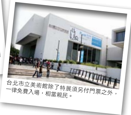
台北市立美術館除了特展須另付門票之外，一律免費入場，相當親民。

位在林蔭大道的現代幾何建築——台北市立美術館，堪稱是最親民的藝術重地，除了參觀特展需要另付門票之外，一般可免費入場，輕鬆欣賞展覽，漫遊國外大師的藝術作品之間，每逢假日還有親子活動，暑期更有充滿悠閒氣氛的夜間開館