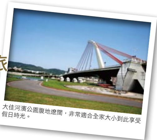
大佳河濱公園腹地遼闊，非常適合全家大小到此享受假日時光。

得相當精緻，而木質打造的內殿感覺十分典雅而幽靜，欣賞完古寺建築，接著轉往中山北路。