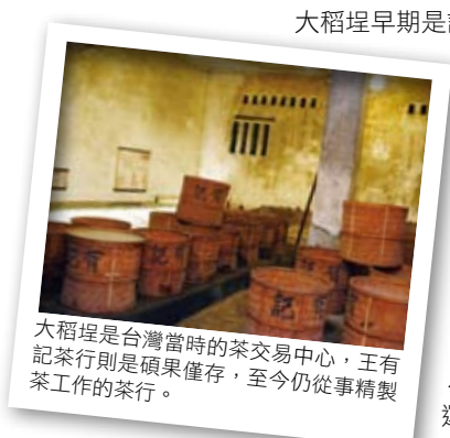
大稻埕是台灣當時的茶交易中心，王有記茶行則是碩果僅存，至今仍從事精製茶工作的茶行。

大稻埕另一個特色就是廟宇多、豪宅多，豪宅是商人彰顯自身財力的標的，廟宇則是商人賺錢之後回饋地方的心意。雖然這些豪宅及廟宇隨著時間變遷而逐漸傾毀損壞，不復以往風華，但漫步其中，回想過去，還是另有一番風味在心頭。