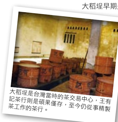
大稻埕是台灣當時的茶交易中心，王有記茶行則是碩果僅存，至今仍從事精製茶工作的茶行。

大稻埕另一個特色就是廟宇多、豪宅多，豪宅是商人彰顯自身財力的標的，廟宇則是商人賺錢之後回饋地方的心意。雖然這些豪宅及廟宇隨著時間變遷而逐漸傾毀損壞，不復以往風華，但漫步其中，回想過去，還是另有一番風味在心頭。