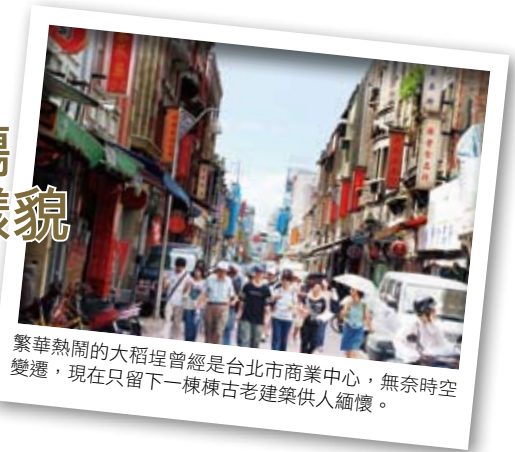
繁華熱鬧的大稻埕曾經是台北市商業中心，無奈時空變遷，現在只留下一棟棟古老建築供人緬懷。