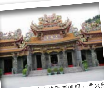
天后宮是當地人的重要信仰，香火鼎盛。

一直居基隆港咽喉位置的和平島，住過東、西方交會的商人、軍人與移民，不同文化的人種競相駐留於此，讓此地蘊藏著迥異的人文生活、