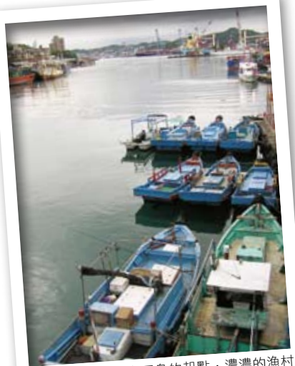
八尺門港是前往和平島的起點，濃濃的漁村風情值得細細品味。

「北社寮、南安平；北雞籠、南大員」，古諺中「社寮」與「雞籠」兩舊名，是現今的和平島與基隆。