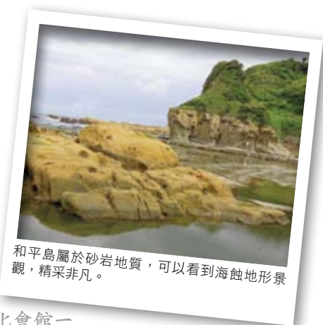
和平島屬於砂岩地質，可以看到海蝕地形景觀，精采非凡。

公園」的和平島，有「皇帝殿」、「萬人堆」等蕈狀岩，「千疊敷」、「豆腐岩」等海蝕平台，以及海蝕溝、海蝕崖、壺穴等怪石嶙峋的地形景緻。步行至和平島海濱地質公園中，還能見到潮間帶中的鮮綠海藻生態，目睹「海女挽海菜」的奇景，是體驗海洋文化與生態的勝地。