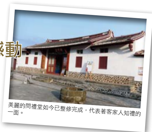
美麗的問禮堂如今已整修完成，代表著客家人知禮的一面。

了圳道引水的技術；來到六家，為了開墾荒地，結合鄰近居民一同修築完成，引入頭前溪溪水。當時的圳路很多，東興圳經水汴頭分流至新瓦屋，變成了十五郎圳、低圳、高圳與麻園圳等4條水路，前述3條如今還安在。