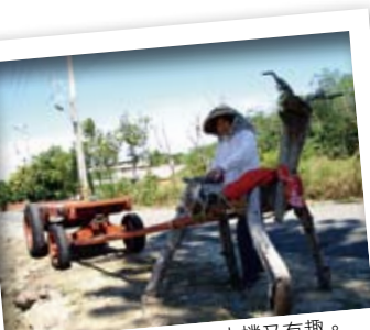
問禮堂前的裝置藝術，古樸又有趣。

客家文化園區（新瓦屋聚落）則是另一個重點，24小時的開放空間，遊客隨時可以進去閒晃。裡面的忠孝堂擺放著250年來林家