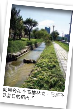
低圳旁如今高樓林立，已經不見昔日的稻田了。

平原路面沒有太多的起伏，沿岸綠樹、水車與花朵，伴著悠悠水流，總讓人猶如走入舊時光的錯覺。其間還可以見到象徵客家農業生活裡重要的伯公廟（即福德正神），因開發而群聚在公園裡聊天的伯公群們，看著古往今來，不知會發出驚喜還是喟嘆？