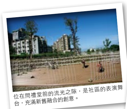
位在問禮堂前的流光之際，是社區的表演舞台，充滿新舊融合的創意。