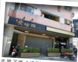
走累了嗎？進到茶行品嚐台中著名的泡沫紅茶吧！