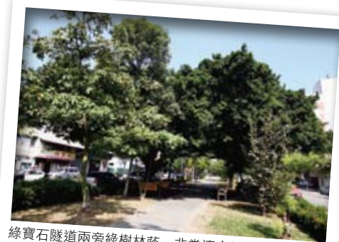
綠寶石隧道兩旁綠樹林蔭，非常適合健走或者騎乘自行車。

元保宮還有三株充滿故事性的老樹，其中一株樹齡兩百年的龍眼樹。據說日據時代有位頗受民眾愛戴的日本郡守，其夫人突生怪病不癒，在神明指示下，到元保宮拜拜，連龍眼樹也要拜。離開時取了廟裡的神符連同龍眼樹葉一起煎煮給夫人服下，沒想到不