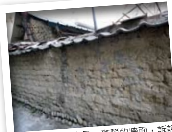
步道中遇見的古厝，斑駁的牆面，訴說著久遠的歷史。

綠樹繁茂，彷彿走進綠色隧道般，令人心曠神怡，更豐富了梅川東、西路三段的都市風光。