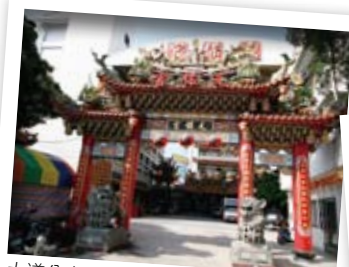
大道公廟是當地人信仰中心，香火相當鼎盛。