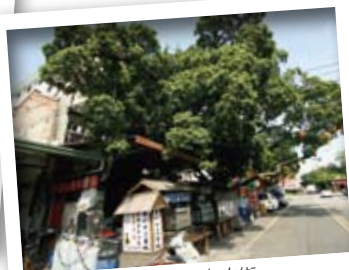
大道公廟外面的美食小吃街。