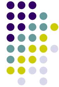
示範計畫資料摘要表