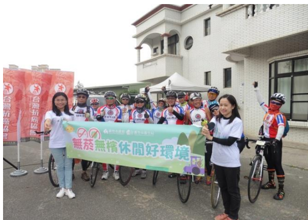
營造無菸檳休閒好環境