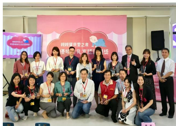
活動場景：特優哺集乳室受獎單位