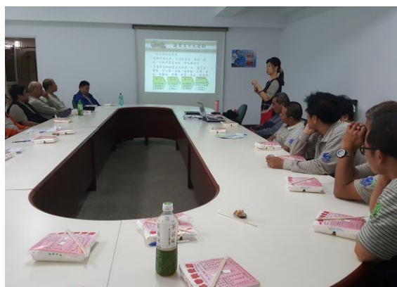
活動場景：新住民生育健康宣導