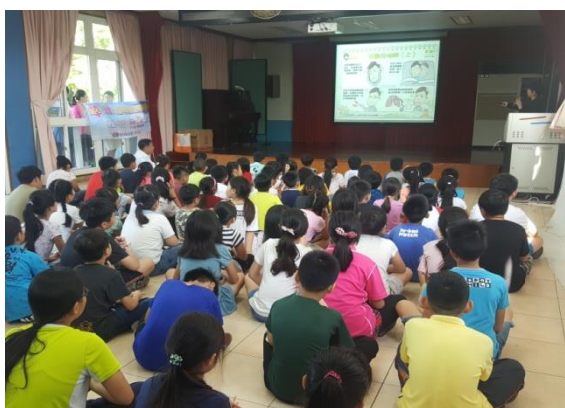
活動場景：辦理青少年性健康促進宣導