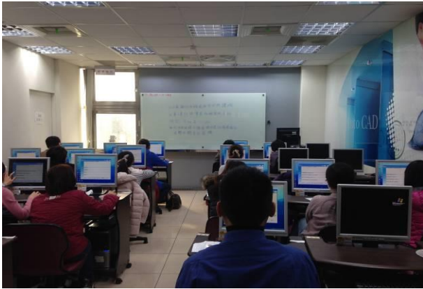
說明： 107年4月28日辦理糖尿病共同照護網醫事人員認證「專業知識」課程電腦考試。