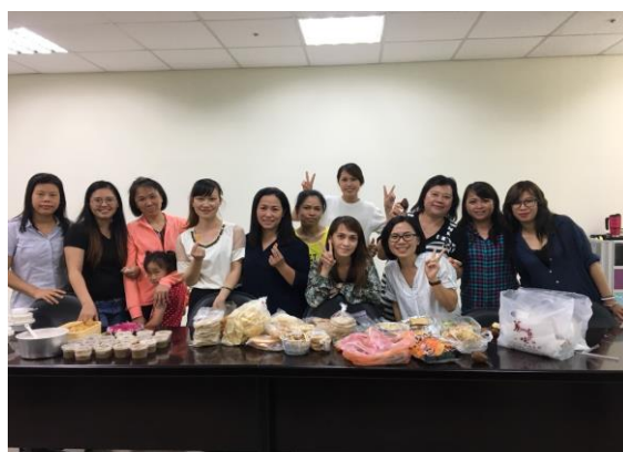
活動場景：新住民通譯員培訓課程