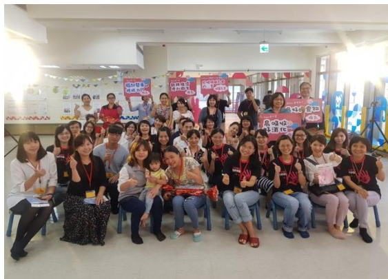
活動場景：國際母乳週-「親親寶貝 愛之泉特優哺集乳室頒 獎活動」