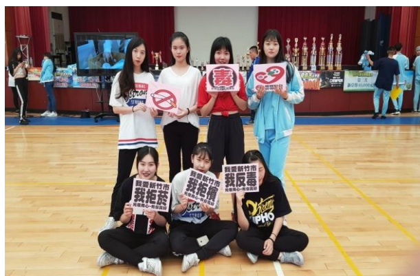
校園辦理拒檳宣導活動