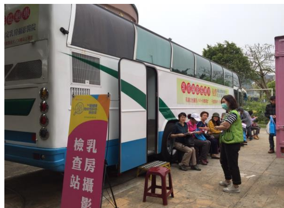
癌症篩檢社區到點服務