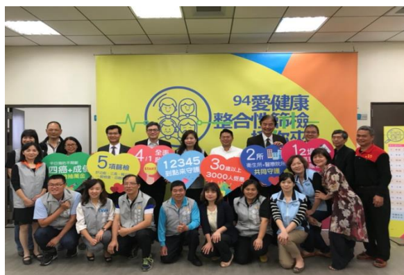
健康篩檢活動記者會