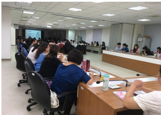
活動場景：辦理兒童視力研習會