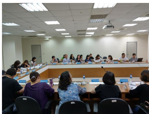
說明： 每個月召開業務連繫會議，進行糖尿病及成人預防保健服務策略研討與精進。