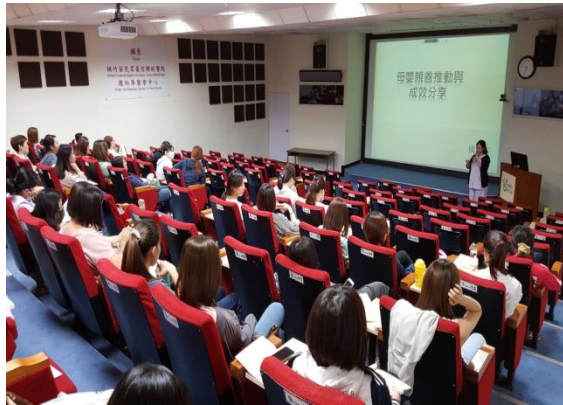
活動場景：辦理母嬰親善研習會