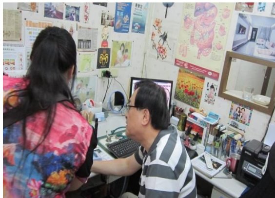
活動場景：醫事人員出生性別宣導