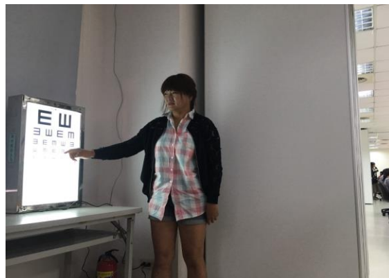
活動場景：辦理兒童視力回復示教研習會