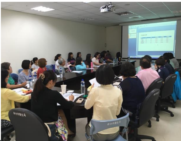
說明： 107年7月26日辦理糖尿病照護觀摩學習暨分享會議。