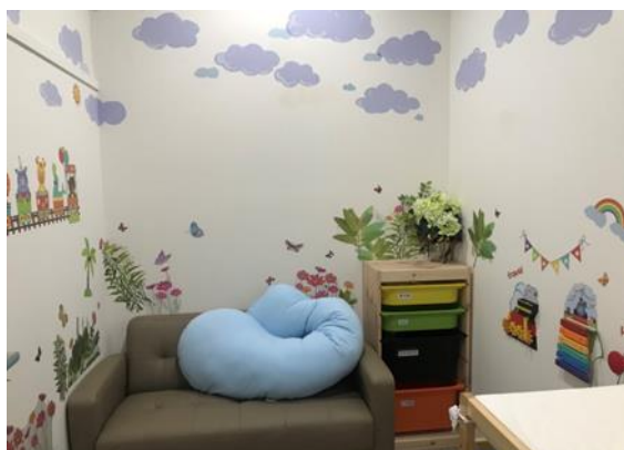
活動場景：新設置哺集乳室