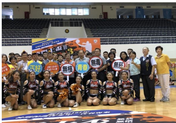
結合各局處宣導拒檳議題