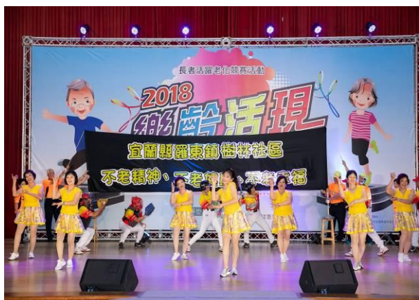
「羅東鎮樹林社區不倒翁活力隊」以各健康 促進團體結合古早童玩，並運用水啞鈴、熱 舞、功夫扇及不老棒球等活動，展現長者平 時活動及力與美