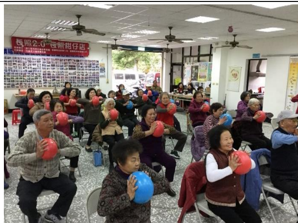
於頭城鎮福成社區進行規律運動宣導