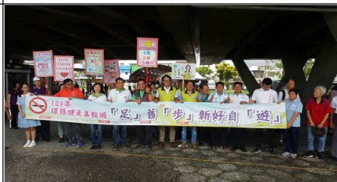
「2018 環縣健走「集點」遊~ 足舊步新好自遊」活動