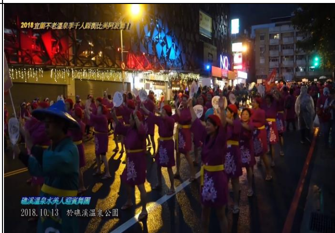
2018 宜蘭不老溫泉季 千人踩街活動