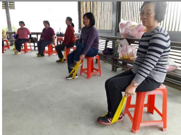
於社區推動長者銀髮平衡體適能