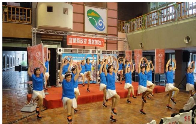
推廣宜蘭尚水健康操