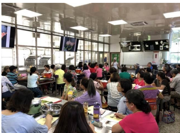
「熟齡健康吃」講座及實務教學