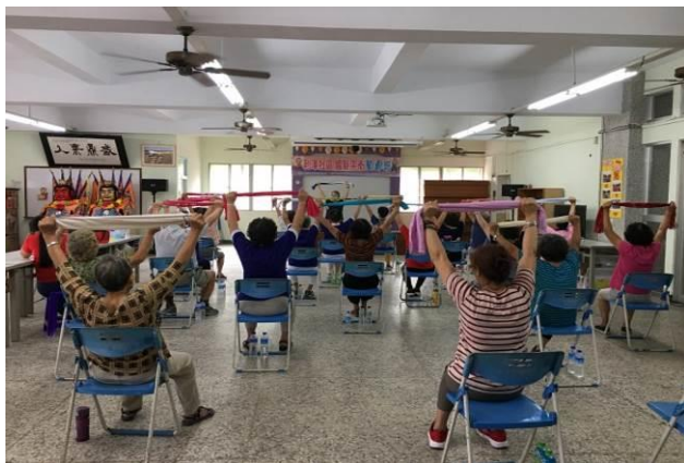
運動介入活動-增強自身體能