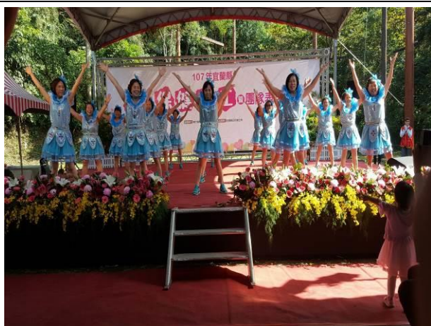
三星鄉尾塹社區長青舞團於 107 年 12 月 1 日受邀參與 107 年宜蘭縣衛生保健志工暨團 隊表揚活動