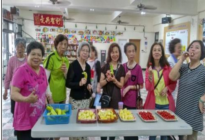
蘇澳鎮蘇北社區營養示範據點~ 纖纖有禮、健康五蔬果