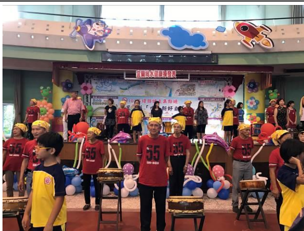
壯圍鄉順和社區銀髮隊於 107 年 6 月 30 日 受邀參與五結鄉環縣健走活動