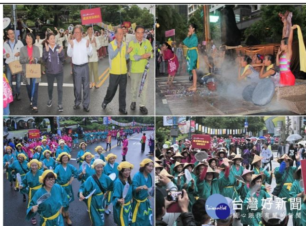
2018 宜蘭不老溫泉季 千人踩街活動