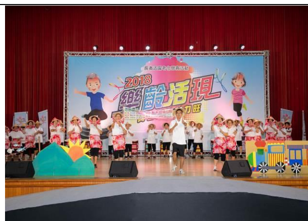
「頭城鎮港口有凍頭隊」藉由雙手舞動將本 土四季謠重新詮釋，呈現出真正的山海味社 區