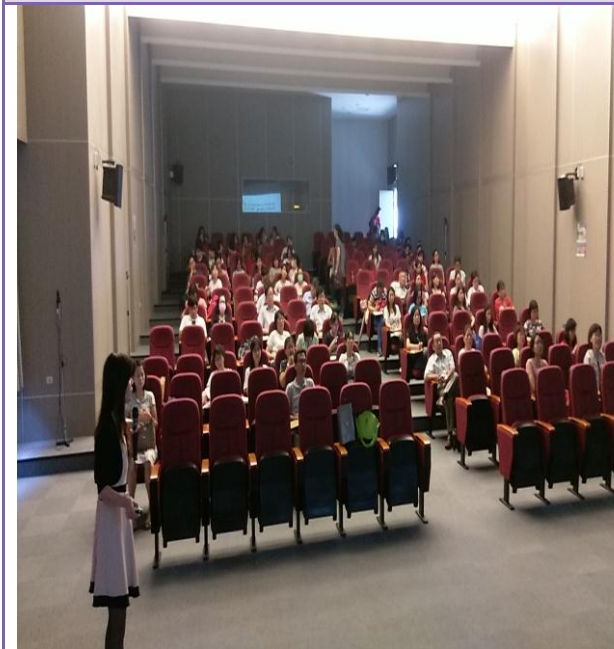
照片內容：辦理糖尿病共同照護網人員認證及繼續教育課程