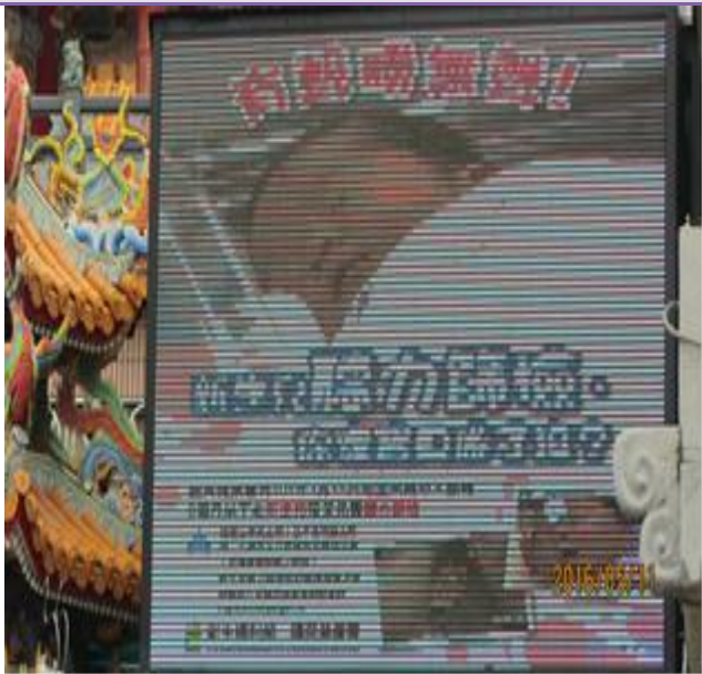
照片內容：105.05.11.於苗栗市：玉清宮電子跑馬燈. 出生 92 天之新生兒可免費施作新生兒聽力篩檢，早期發現早期治療，勿錯過黃金治療期