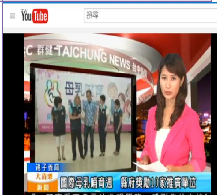
照片內容：105 年 8 月 4 日於苗栗縣政府衛生局辦理國際母乳週記者會，由本縣縣長及衛生局局長和保健科科长支持母乳哺育並頒發獎牌給優良哺集乳室單位；並由電視台報紙等媒體宣傳。