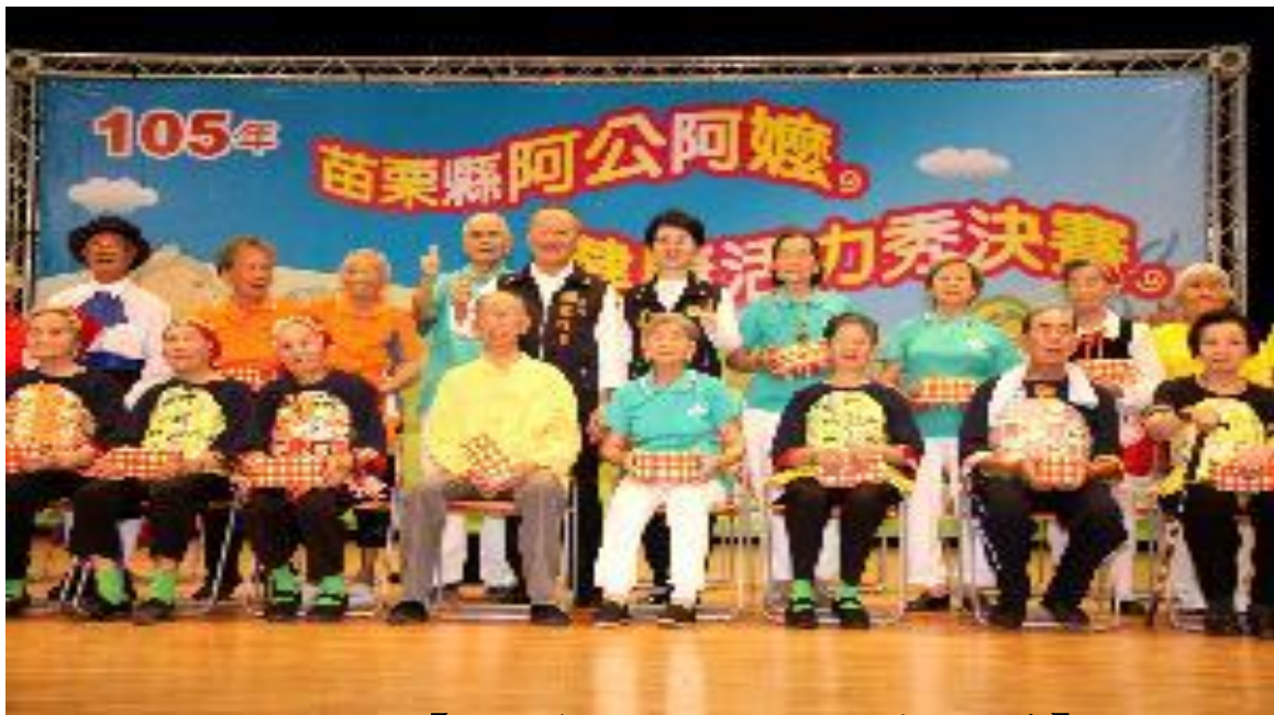
活動名稱：【苗栗縣 2016 阿公阿嬤健康活力秀】