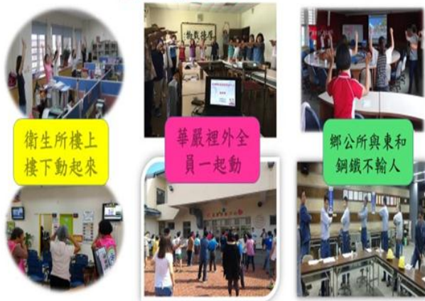
照片內容：影響各鄉鎮公務機關、小型職場利用上班 15 分鐘做健康操