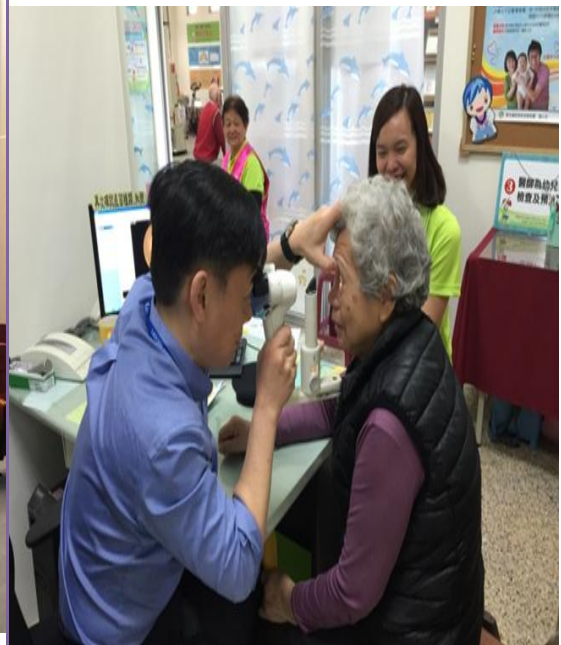
照片內容：糖尿病個案視網膜檢查