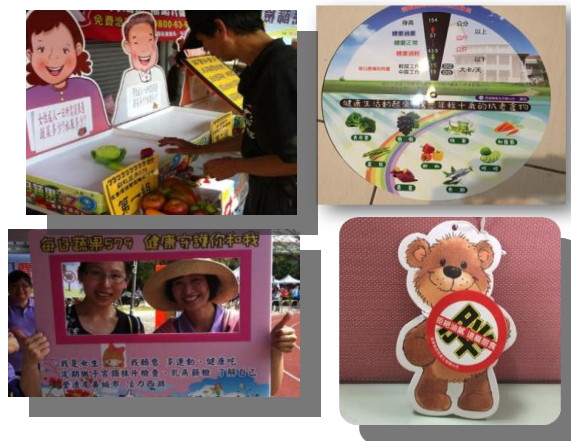
照片內容：創意教材宣導，讓民眾能透過生動活潑的教材，讓健康知識簡單明瞭