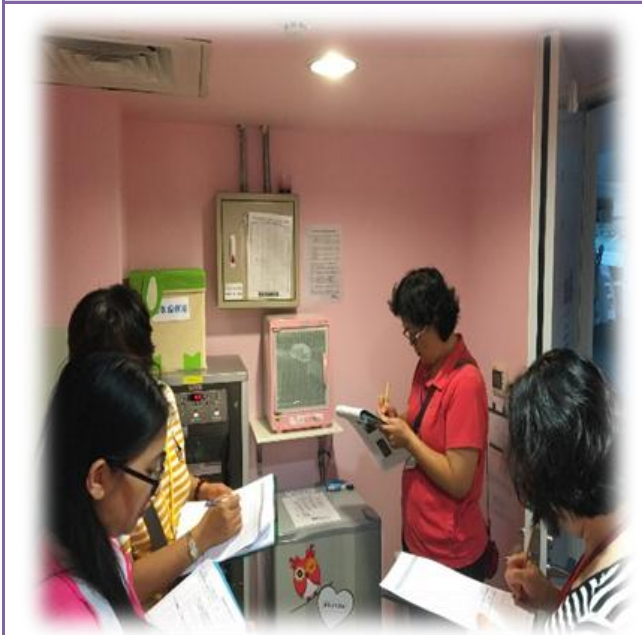
照片內容：105 年 7 月 11 日哺集乳室競賽於苗栗客家文化園區實地評核。