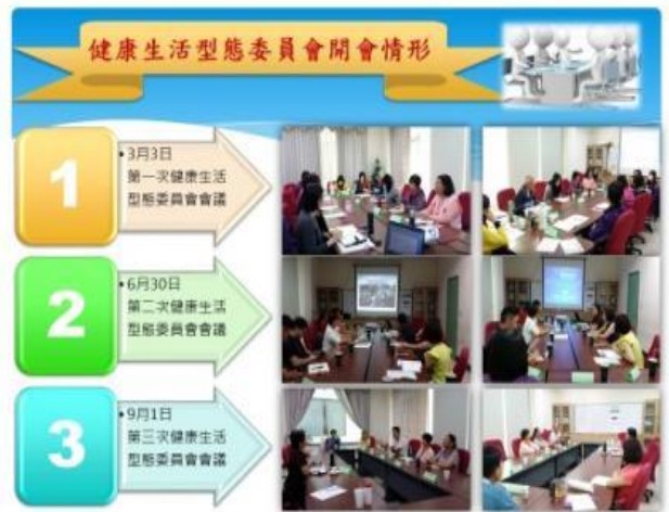
照片內容：致胖環境改善委員會開會情形