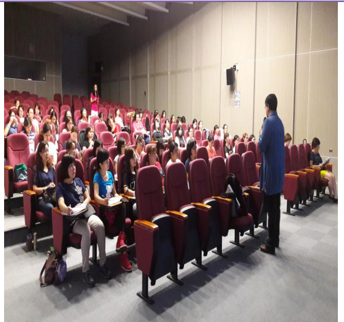
照片內容：105 年 6 月 17 日於苗栗縣政府衛生局辦理母嬰親善教育訓練。