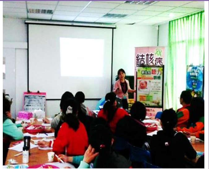
照片內容：105 年 3 月 29 日於苑裡鎮衛生所 2 樓針對幼兒園老師針對學校老師辦理新生兒聽力說明會，宣導新生兒聽力篩檢之時間，執行方式及轉介追蹤轄區之醫療院，強調聽力初篩及複篩之意義。