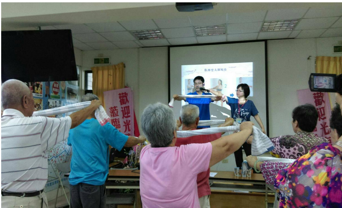
活動名稱：大千醫院復健師來代長者做毛巾操