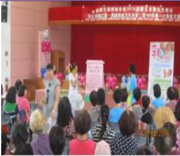
照片內容：105 年 5 月 29 日於大湖鄉老人文康活動中心，針對大湖鄉婦女及新住民辦理新生兒聽力篩檢宣導活動