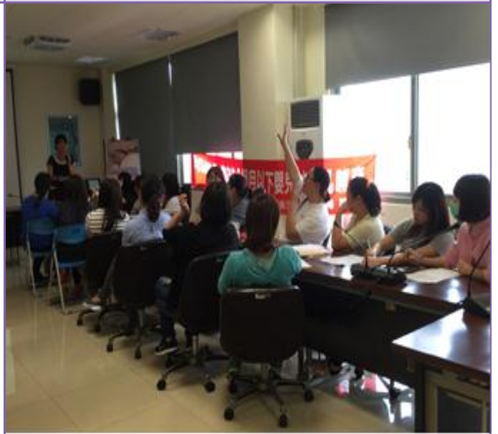
照片內容：105 年 04 月 20 日於後龍衛生所針對幼托園所教師及國小護理師，藉由宣導告知民眾本國籍 3 個月以下新生兒聽力進行免費篩檢。