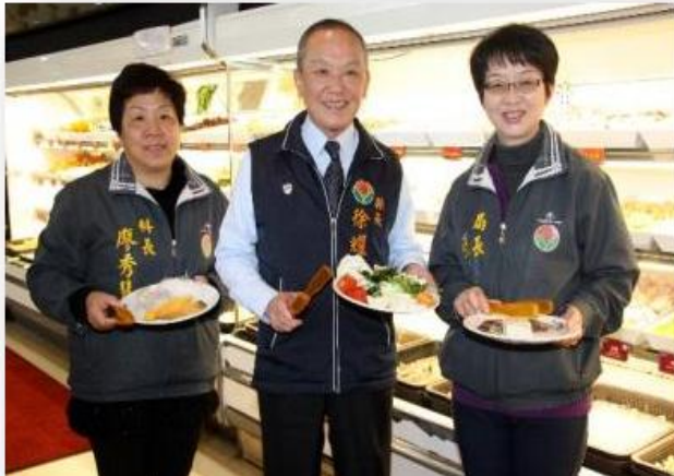
照片內容：聰明吃火鍋苗栗縣長教健康撇步