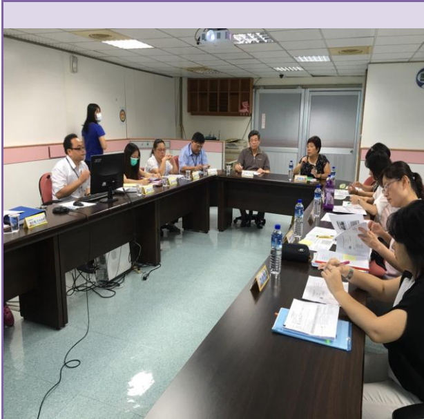
照片內容：醫療院所業務聯繫及輔導