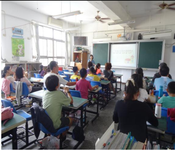
*辦理幼童居家安全研討會