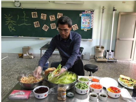
4/27 假金湖國中理健康減重講座~傳授如何天天五蔬果及其益處、指導簡易製作五色蔬果沙拉的方法