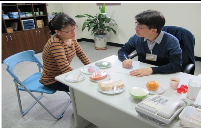
營養師針對個案進行個別性諮詢衛教