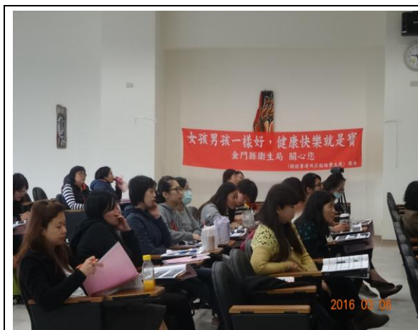
縮小出生性別差距醫事人員教訓