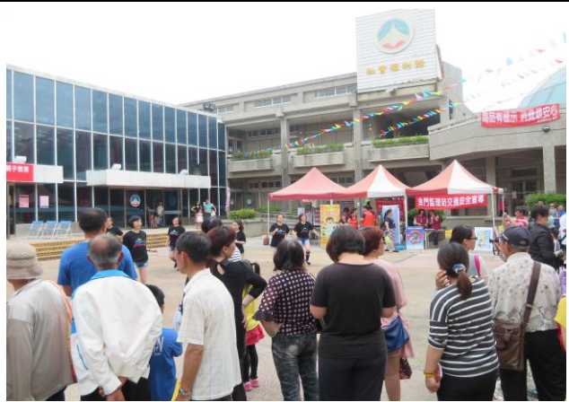
*配合新住民活動宣導產檢、乙型鏈球菌篩檢補助