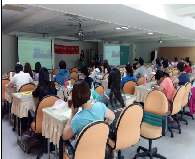
*2016 辦理「辦理腎臟病醫事人員繼續教育訓練」活動。