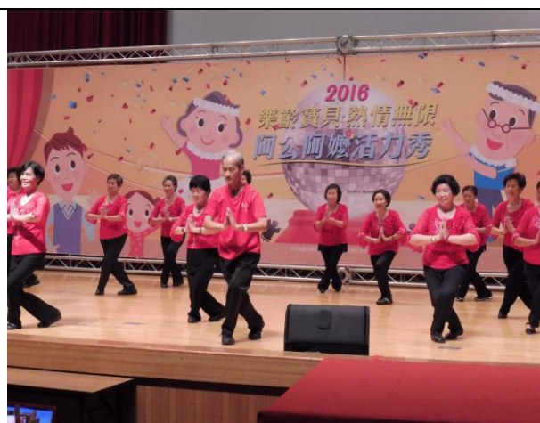
*2016 樂齡寶貝熱情無限阿公阿嬤活力秀-全國總決賽參賽人員現場表演場景。