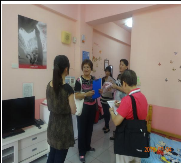
哺(集)乳室競賽評審評分情形