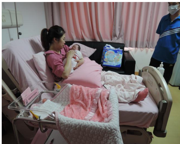
產婦執行親子同室情形