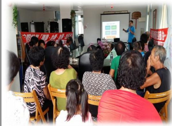
105 年 10~11 月份辦理代謝症候防治衛教宣導活動