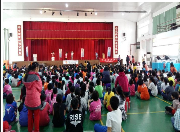
105.4.26 結合 open 小將假金湖國小辦理代謝症候群宣導活動