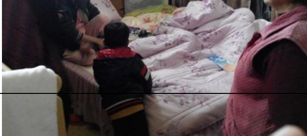
聽力篩檢的重要性衛教