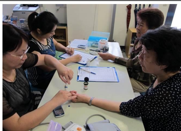
烈嶼鄉衛生所幫糖友做血壓血糖監測