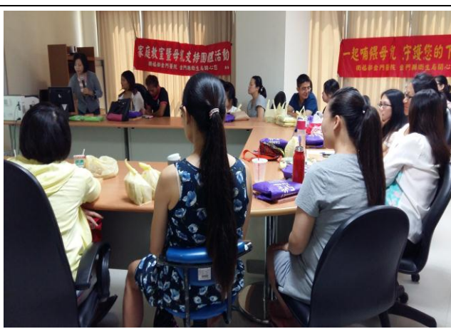
向準爸媽們宣導女生男生都是寶的觀念