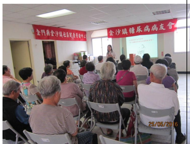
社區宣導糖尿病及代謝症候群防治講座