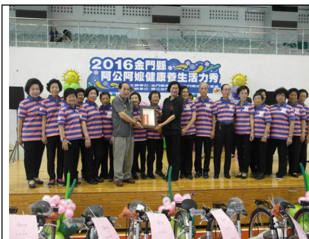
*2016 金門縣阿公阿嬤健康養生活力秀得獎人員合影留念。