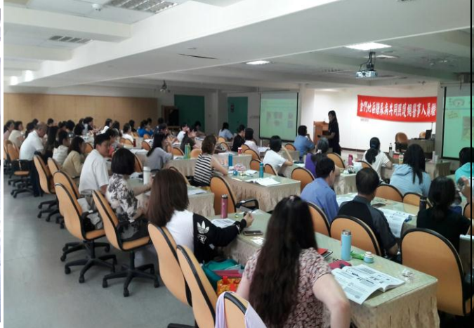
辦理本縣醫事人員繼續教育課程