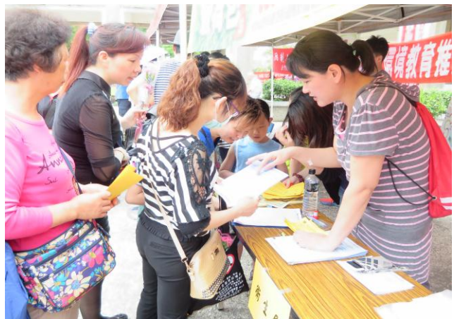
*辦理產檢補助、乙型鏈球菌篩檢補助宣導