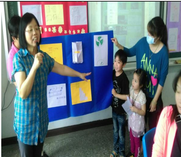
*辦理自我導向學習式「幼童居家安全」活動暨改善前及改善後成果展現活動。