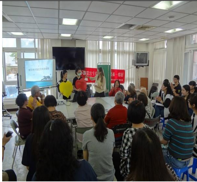
106. 5. 9. 糖尿病支持團體運作工作坊 (地點:竹北市衛生所)