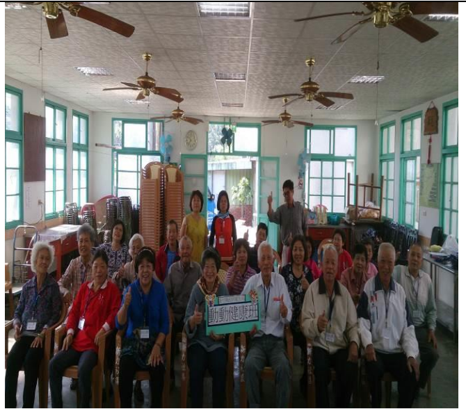
106. 9. 25. 新竹縣政府衛生局-動動健康班 (地點:關西鎮新力里)