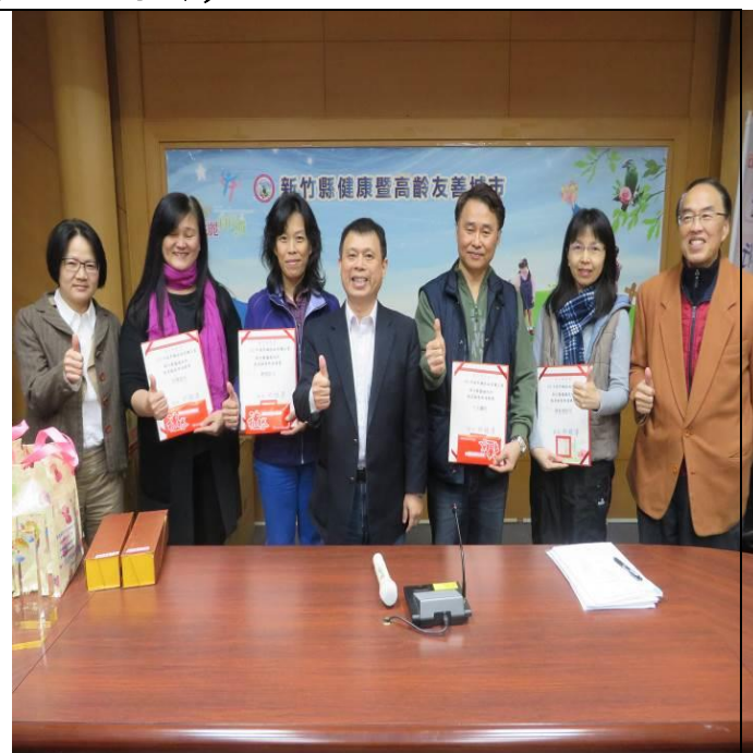
106.3.14. 局長頒發獎狀及禮卷鼓勵眼底檢查率達標之醫療院所