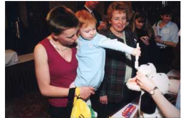
兒童健康示範計畫