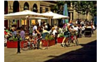
以上 2 照片取自 http://www.glasgow.gov.uk/