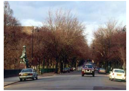
市區道路景觀，吳玉成攝