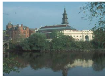
克萊德河畔的漁市場，是格城最早發展的點，吳玉成攝

國民生產毛額 GDP： 總值 10200 百萬英鎊，每人 16500 英鎊=27390 美元=924000 台幣（Glasgow 2002 Labour market statement）