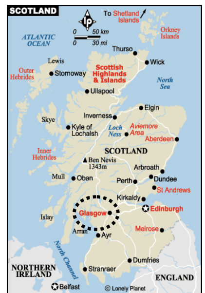
格拉斯哥位置示意圖