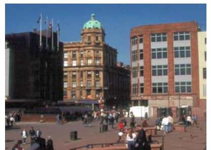
人群於廣場活動情形