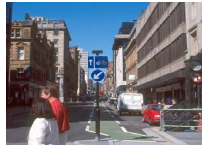
市區腳踏車道