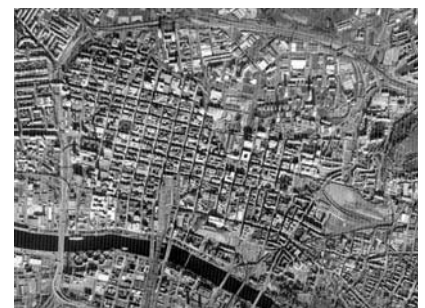
圖1：格拉斯哥市中心紋理