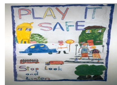
Dundrum Ballinteer 安全計劃

此計劃在西元 1997 年建立並和將近 100 個國家及當地組織一同設法降低 Dundrum Ballinteer 地區之意外事件。此活動涵蓋相當多不同層級，包括電台宣傳、當地報紙文章宣傳、與團體及學校談安全問題、舉辦學校安全週、舉辦展覽等。最近的一個計劃是 DUMP（這是一個處理廢棄藥物的計劃）。