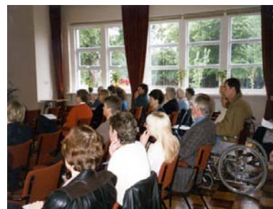
Swords 地區動態生活計劃

Swords Active Project 屬於都柏林健康城市計劃的一部份，其目的在於深耕主動式生活方式於一般社區間。一開始所有當地的運動組織及社區團體都被邀請參加會議討論此計畫之進行模式。其計畫包括爲了盲人設立的「會說話的報紙 (Talking Newspaper)」、成立健走俱樂部、出版 Swords 地區運動相關組織的目錄、在學校及社區活動中心成立舞蹈班等。