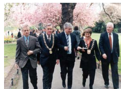
"Rainbow Walking Challenge"活動

此活動鼓勵人們藉由走路發展出動態生活方式。"彩虹" (Rainbow) 一字意指參與者遵循按照其年齡及運動能力分類的五色編碼的計劃。此活動於西元 1991 年舉辦並且有數千人參與在 Phoenix 公園、Malahide 城堡等的 Walk Festivals。