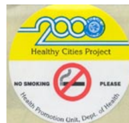
戒菸 CD-ROM 遊戲