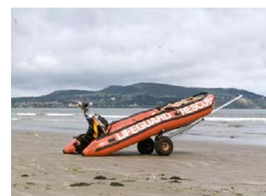
愛爾蘭意外預防指南

此計劃在西元 1994 到 1995 年間開始並且在同時在都柏林、利物浦及捷克的小鎮 Trebon 執行。此計畫發展出相當好的資料及運用的模型，並且提供世界衛生組織健康城市工作小組一個相當不錯的例子。