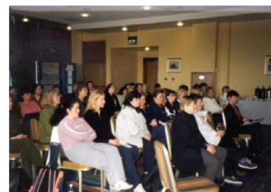
「女性、低收入與抽菸」計劃