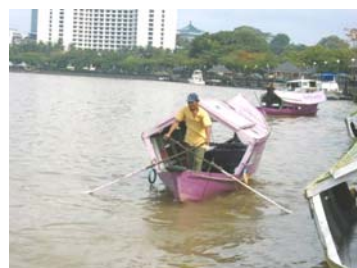
古晉河上主要交通工具