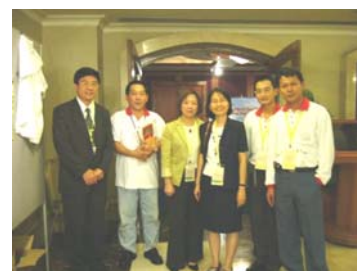
與大會接待人員合影

參與古晉國際研討會可學習如何舉辦國際研討會，由於有來自各國的人參加，再加上住宿與交通問題，讓舉辦國際研討會的複雜程度遠遠超過國內的小型研討會，而這些住宿、用餐、交通與場地安排等等的行政管理問題，