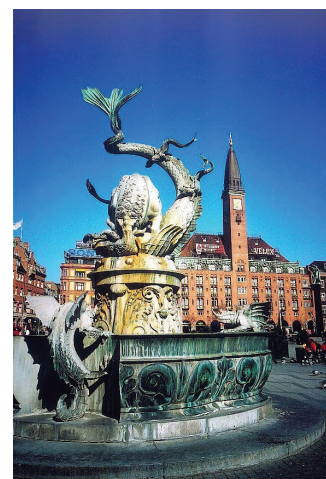
圖 4：雕像、噴泉全集古老建築座於市區內，交織成一幅童話。