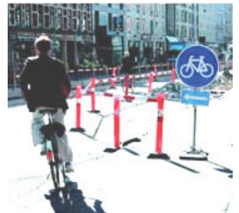
圖 15：道路施工時，工程單位會加設指標引領自行車者