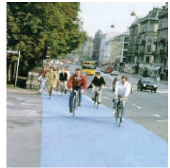
圖 12：在政府大力推動下，市區內民眾騎乘自行車的風氣極盛。

「城市自行車」方案於 1989 年開始執行，其最初的主要目的是要去解決城市中自行車偷竊的問題，其計畫會從保險公司那邊獲得資助，做為自行車失竊的補償費用，而在 1991 年時，方案的進展因為可獲得基金的不足而觸礁。1994 年初期，此方案因為非營利決策基金會（"Fonden Bicyclen i København"）的創立而再度邁向光明，此基金會擁有來自政府部門及民間