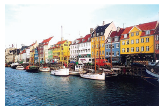
圖 5：哥本哈根在丹麥文中爲『商人的港』或『貿易港』，爲丹麥的最大商港。

http://www.cas.ac.cn/images/s/ny/4645/34/76.jpg