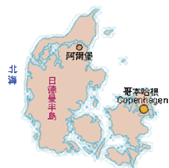
圖 3：哥本哈根位置圖

哥本哈根於 1988 年參加了 WHO 的健康城市計畫，並且由此時開始，對公共衛生擁有一段長期的允諾，並於隔年 1989 年，在哥本哈根成立了第一個健康城市辦公室，且哥本哈根健康城市計畫爲哥本哈根衛生部門的一部份。在 1992 年 5 月，市政府爲了準備健康城市計畫，特別製作了一個提案，並由一個跨部門的指導團隊來執行今後的工作，並且在計畫協調者的協助下，替委員會成立了秘書處，哥本哈根健康城市計畫在計畫的籌備中，可謂