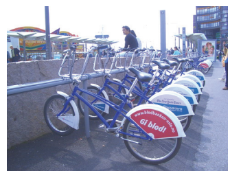
圖 13：政府提供市民及旅客單車使用服務，投入 20 克朗取車，還車時會再退還。 http://www.go2eu.com/modules/newbb