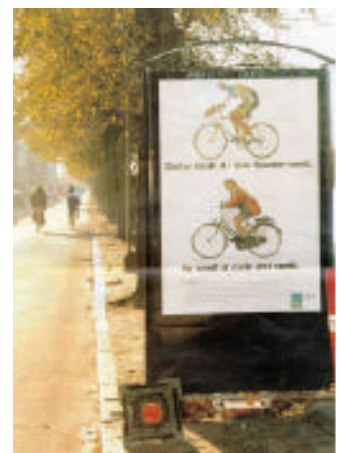
圖 16：由於丹麥政府非常重視空氣污染與環保問題，為了倡導民眾有更多的身體活動，市區內每條馬路都有規劃良好的自行車道。