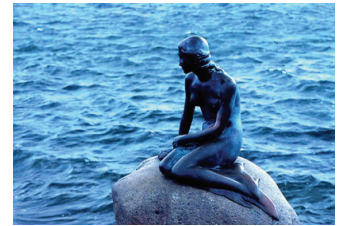
圖 6：哥本哈根俗稱美人魚故鄉

在1994年1月，哥本哈根健康城市計畫的提案被發表，它顯示這個計畫與傳統健康照護計畫是如何的不同，健康城市計畫強調行動部門要如何承擔哥本哈根的健康問題，它以城市中既有的技能與力量做考量，為所有的相關部門設立重新了重點與目標，並對目前及未來的健康促進的行動提供一個架構。哥本哈根計畫選擇了三個主題：社會網絡、正向的健康行為及環境改善，這些主題都是可透過健康促進而被增進的。這個抉擇構成了計畫內方法的基礎，這些方法針對重要的健康與城市主