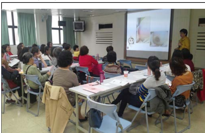
說明：104.04.25 假基隆市衛生局辦理 104 年母乳哺育志工研習。