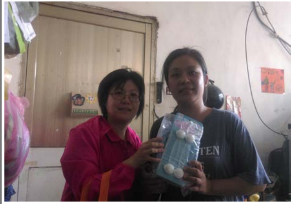
提供居家安全目標族群相關宣導品