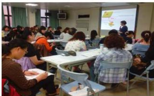
1040424衛生所人員繼續教育訓練