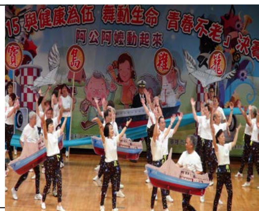
「2015 舞動青春 阿公阿嬤動起來」 總決賽比賽情形