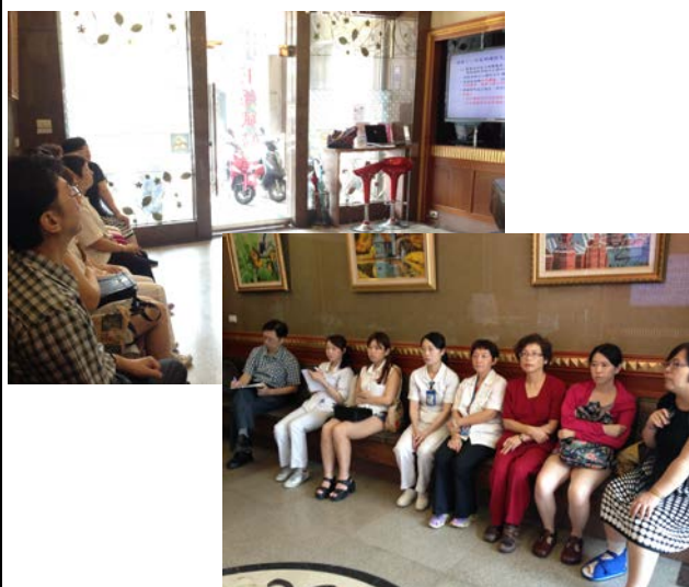
說明：104 年度本市診所母嬰親善醫療院所認證輔導。