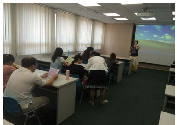
結合移民署宣導相關衛生保健