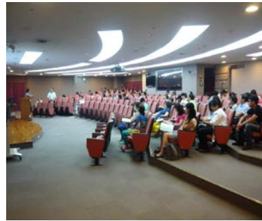
說明:7月5日辦理醫事人員教育訓練