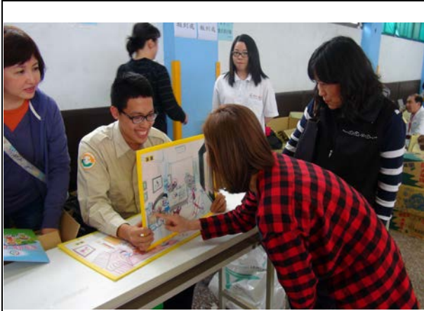
104年4月22日國小暨幼兒園潔牙比賽—居家安全設攤宣導。