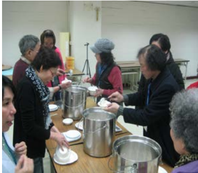
說明:3月11日辦理2014健康樂活營