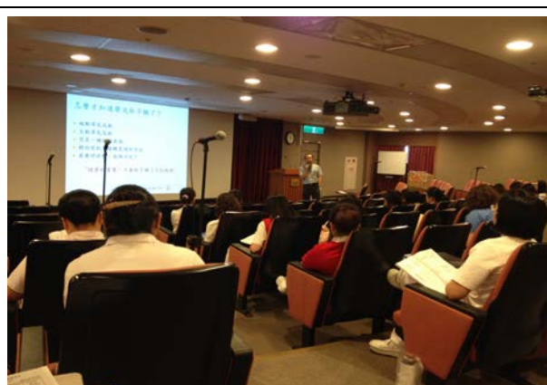
說明：104.07.29 假長庚醫療財團法人基隆長庚醫院辦理 104 年母乳哺育專業人員進階教育訓練。