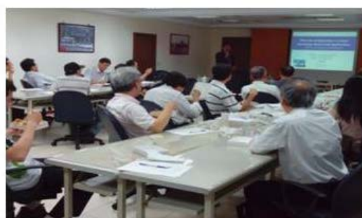
1040914腸篩防治醫師教育訓練