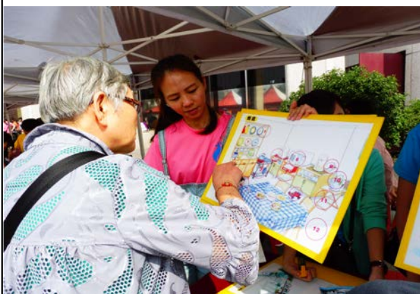
104年11月7日人口政策暨世界糖尿病日 宣導—居家安全設攤宣導。