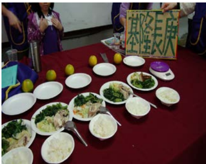
說明:世界糖尿病日「健康飲食 甜蜜生