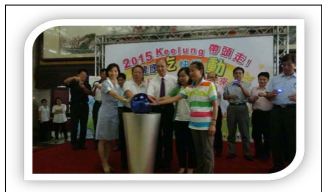
說明：「2015 Keelung 帶頭走」健康「吃」快樂「動」幸福滿分 全民動起來 記者會