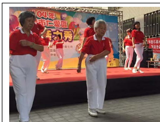
「2015 舞動青春 阿公阿嬤動起來」 初賽