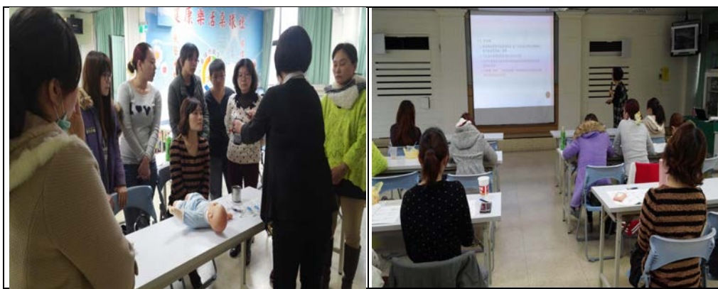
104年4月11日假基隆市衛生局，辦理新生兒聽力篩檢研習。