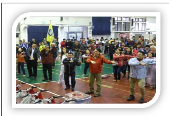
說明：市長帶動推動健康操