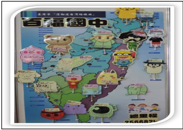
說明：辦理運動遊臺灣跑活動成效圖