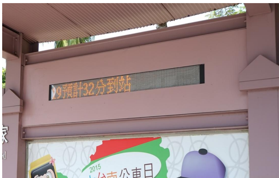
圖 1、增設語音播報設備模組，提供公車即時進站資訊語音播報