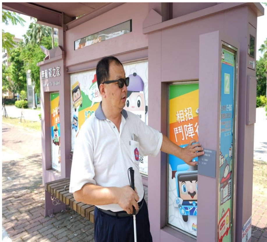
圖 3、特邀請視障團體協助檢驗候車亭掃盲設施可用性

為便利老年與視障朋友無礙使用大台南公車，本市交通局於公車動態顯示器內裝設語音播報設備模組，以提供公車即時進站資訊語音播報，並且在候車亭增設公車資訊盲人點字板。在前述掃盲設施建置過程中，特邀請「臺南市盲人福利協進會」、「臺南市佑明視障協進會」等視障團體協助檢驗設施可用性，詳如圖 3。