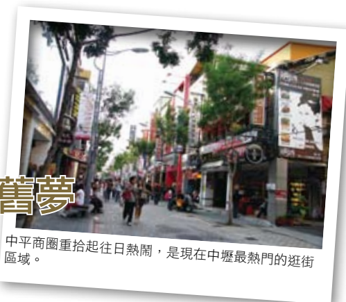
中平商圈重拾起往日熱鬧，是現在中壢最熱門的逛街區域。