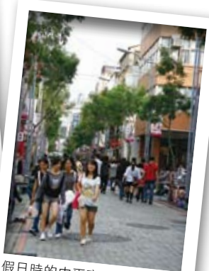
假日時的中平商圈擠滿了年輕人，就像台北東區鬧街。