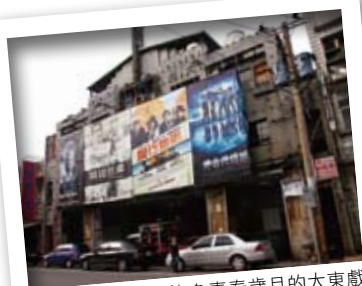
伴隨著老中壢人許多青春歲月的大東戲院，也在2006年時悄悄落幕了。

延伸中平路的永興街，曾是中壢的市場與最早夜市。由大東戲院開始，這一帶的夜晚璀璨，找吃的、找娛樂，來這裡準沒錯；後來夜市遷移，這裡也逐漸沒落；轉型成徒步區後，商圈漸漸恢復元氣。