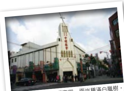
中壢教會一帶的中平商圈，兩岸種滿白臘樹，頗具異國情調。

74年前，中壢的中平路是一條長長的石子路，人力輕便車在此「嘎嘎」作響往來穿梭，南來北往的雜貨在這裡集散。由火車站運來再轉由車子運走，道路變成了商街，人潮絡繹不絕。商圈轉移後，喧囂歸於平淡，在一切重新開始的未來裡，商圈再度點亮希望，以新穎面貌迎接再現的風光。