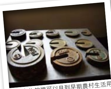
農村文物館裡可以見到早期農村生活用具，如磅秤。

走在村莊，居民對訪客極友善，不禁讓人回味起台灣早期農業社會大稻埕文化的人情味，而這裡的確是這樣。念舊的村民們為了喚回年輕人對鄉土的記憶，特別以民間力量收集