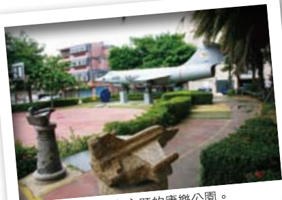
以空軍戰事風光為主題的康樂公園。