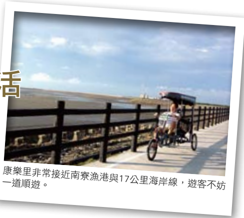
康樂里非常接近南寮漁港與17公里海岸線，遊客不妨一道順遊。

從繁華的新竹市區走過，涼風襲來、已近海邊，順著小巷入糠榔庄，眼前的風景一轉，矮房、古厝、菜園以及騎鐵馬悠閒而過的耆老，30秒鐘前的市區喧囂有如雲煙，消散在這獨自美麗而寂靜的聚落裡面。