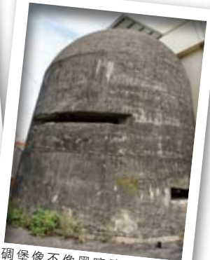
碉堡像不像黑暗武士的面具呢？

在步行的起點康樂公園裡，村民特別留下的幾棵糠榔樹，就可以將村名解釋清楚。在康樂公園中，除了糠榔樹之外，最引人著名的就是一座F104戰機。這架戰機可是大有來頭，由於康樂里位於新竹機場旁，常常可以聽見空軍「轟隆」一聲劃破天際的飛機聲響，鬧聲隆隆。為了回報居民們的體諒，空軍基地便將年久報廢的飛機，送給康樂里作為禮物，而里民們也將這架飛機供在公園中，作為敦親睦鄰的最佳展示品。