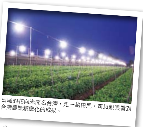
田尾的花向來聞名台灣，走一趟田尾，可以親眼看到台灣農業精緻化的成果。

田尾的花草事業最早可追溯到一百多年前打簾村民巫修齊說起，因為家境不錯，兄弟之間頗有蒔花弄草的閒情，因而成為當地花卉產業之濫觴。到了日治時代，巫家叔侄將花木栽培職業化，並與農會合作育種，進而讓田尾的花卉產業有如百花爭放，並將田尾打造成「花卉的故鄉」。