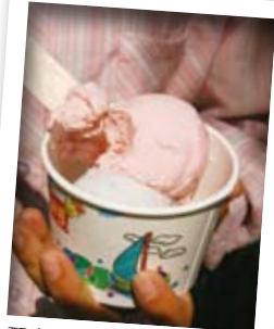
配合著園藝，當地店家也發展出各式花草口味的冰淇淋。

是當地最具特色的料理之一。瑞楓花卉則是一家專門販售開運竹的店家，裡裡外外都擺放著各式各樣的幸運竹，各種造型都有，以供應許多人節日應景所需。金菊園則是主人自己設計打造的庭園，提供餐飲、壓花、組合盆栽等DIY活動，由於老闆從事田尾社造工作，對當地有深厚的了解，遊客有任何問題均可向他諮詢。