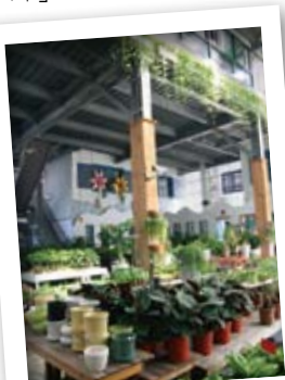
花園裡的盆栽排排站，令人不由自主想親近。

沿著公路花園中的民族路一路走去，是尋訪百年前田尾花卉事業的最佳路線。沿途依稀可見先人們沿著田間開發出來的彎曲小路，在周休假期中，已然成為賞花古道，同時可讓遊客體驗田尾早期的風貌。