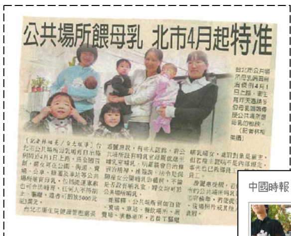
99. 1. 11. 聯合晚報