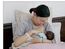
The head of Taipei's health promotion division says a new regulation on mothers breastfeeding in public is an enhancement of women's rights

TAIPEI (UCAN) — Catholic healthcare workers and mothers of newborns have welcomed a new regulation that protects a woman's right to breastfeed her baby in public.