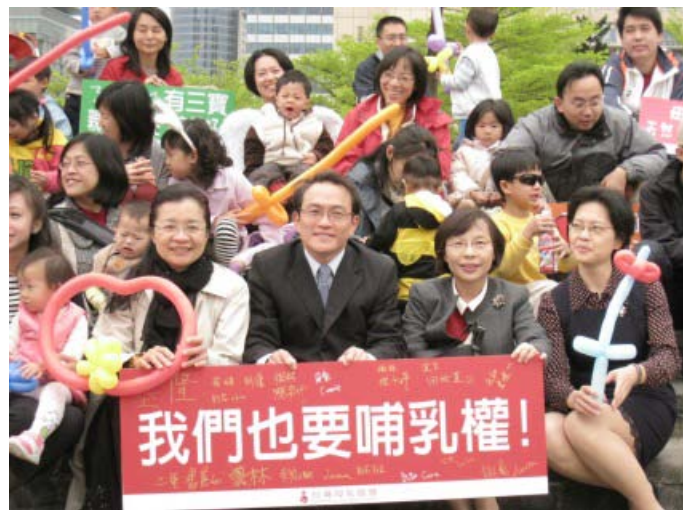
圖：各縣市哺乳媽媽爭取公共場所哺乳權