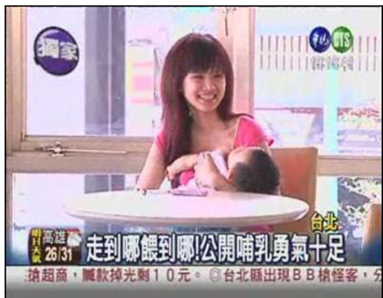
99. 5. 24 華視新聞