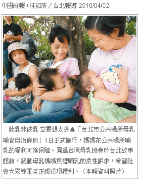
99. 4. 2. 中國時報