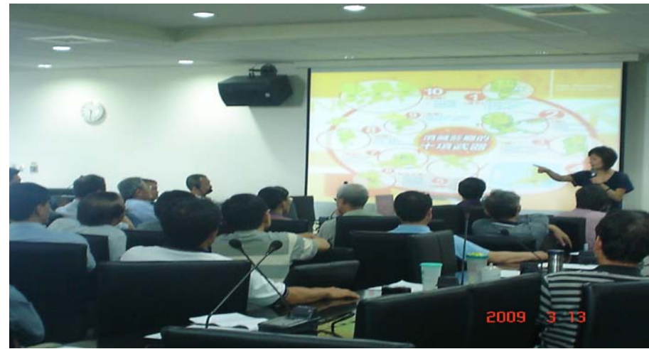
腎臟保健社區衛教 Health education in Local Communities