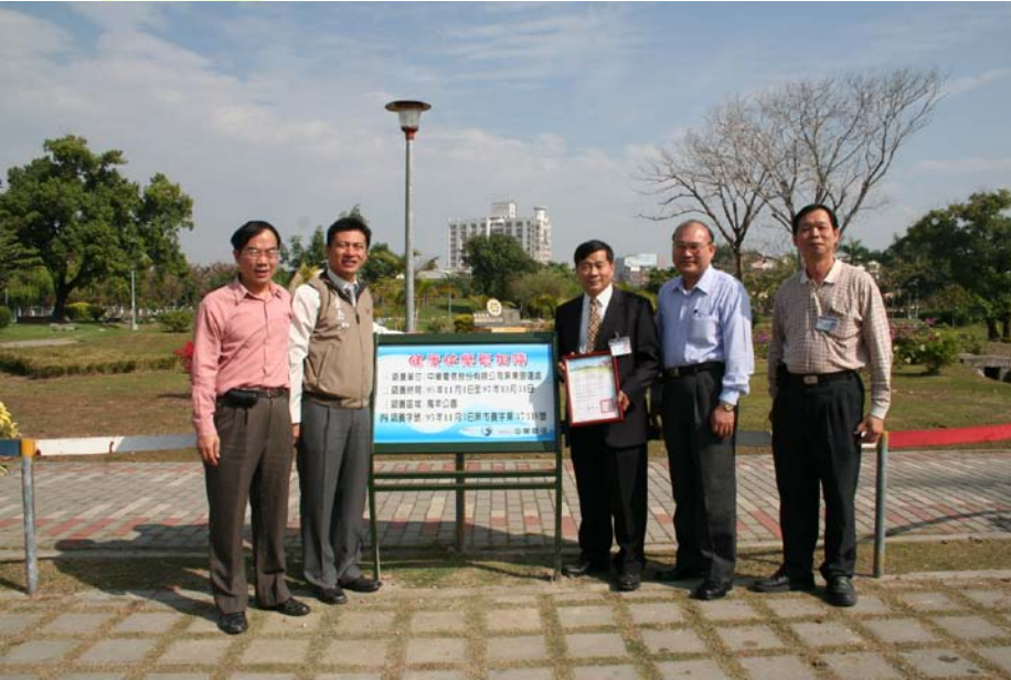
中華電信公司認養公園(萬年公園) Adopt-A-Park, Enterprises Sponsor