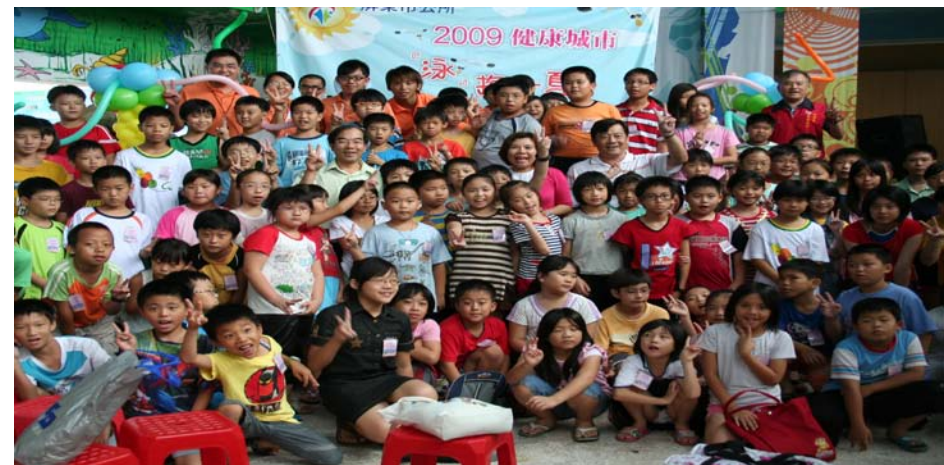
千人減壓活動 Thousand Citizens in Anti-Stress Campaign