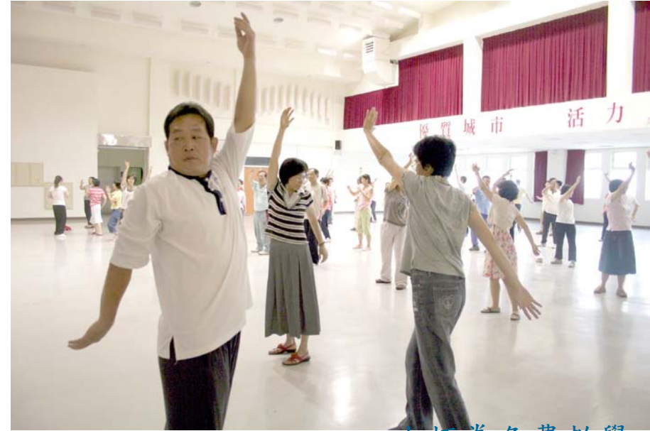
太極拳免費教學 Free Tai-chi Training