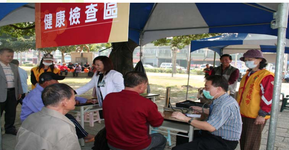
市民免費健康檢查活動_屏東中山公園 Free Physical Examination in a Park