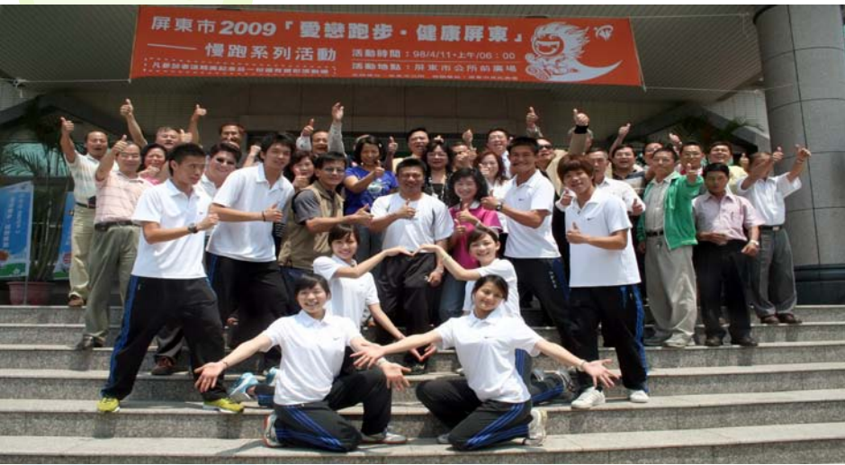
「愛戀跑步，健康屏東」 30,000人次 'Jogging Fans, Pingtung' 30,000 Runners