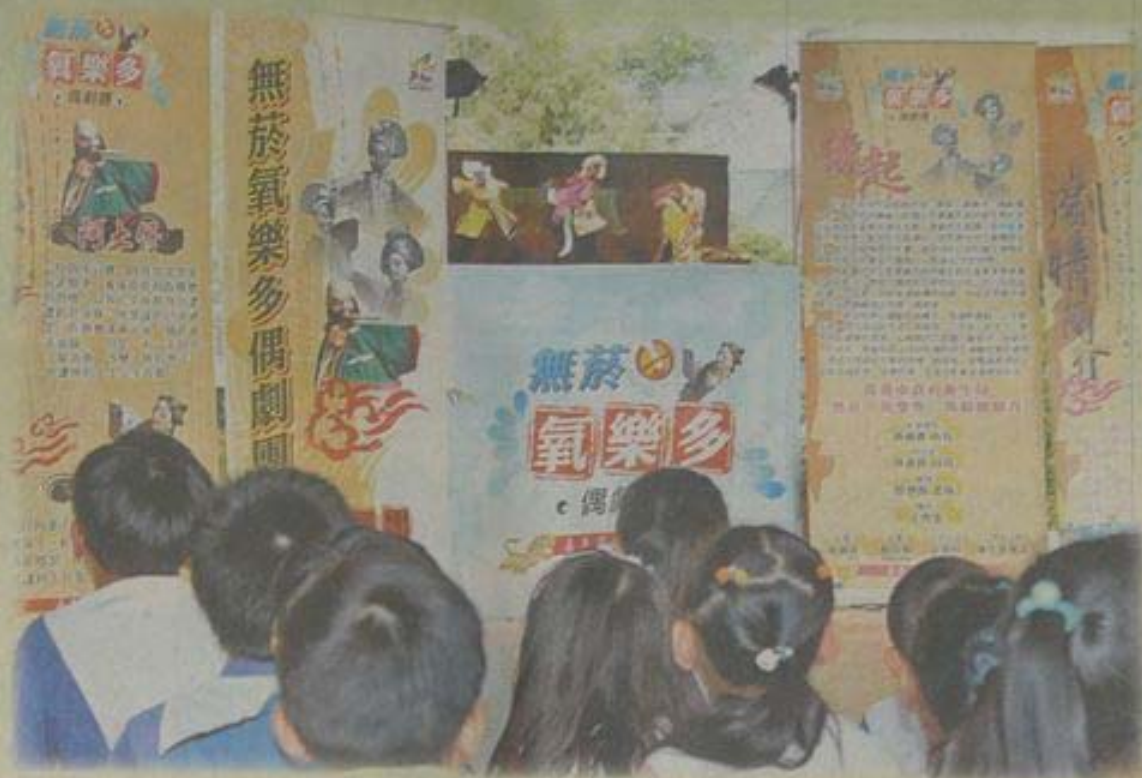
嘉市衛生局無菸「氣樂多」偶劇團，昨天到僑平國小進行拒菸宣導。

衛生局表示，該偶劇團成員由衛生局志工組成，平均年齡超過60歲的阿公阿婆，去年11月成軍後，於文化公園首演，造成廣大迴響，並獲選今年全國保健會議「最佳衛教素材創意獎」。今年安排5場國小校園巡迴，由編導蔡坤福老師帶領，進行拒菸教育宣導活動。