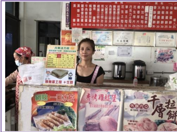
輔導校園周邊早餐店美又美-鮪魚蛋吐司 +牛奶