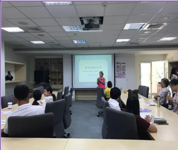
照片內容：107.07.18於苗栗工藝園區針對 新住民及其家屬 ，宣導未納健保產前補助相關訊息，並提供新住民相關照護及母嬰照護資訊網站。。