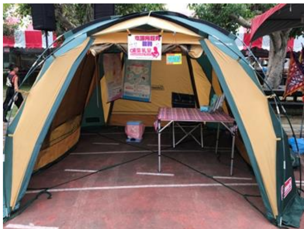
照片內容： 107 年 4 月 29 日苗栗縣南埔國小文武宮輔導大型活動場次設置哺集乳室