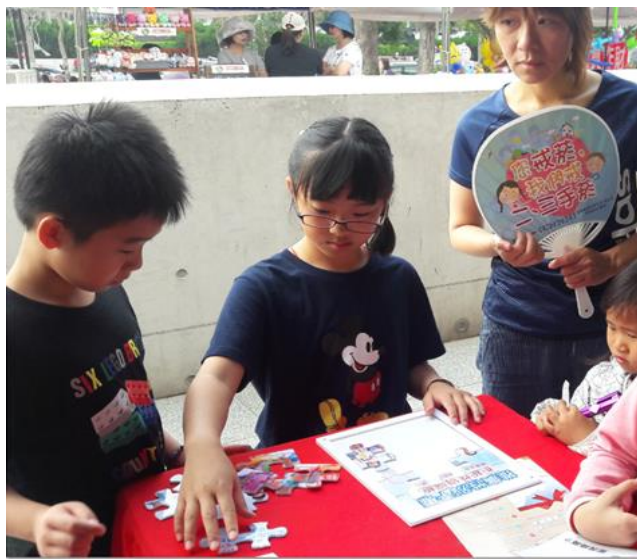
照片內容：107年4月1日於苗北藝文中心藉由 玩拼圖 ，針對 爸媽及孩童 宣導 性別平權 拒絕性別篩選重要性