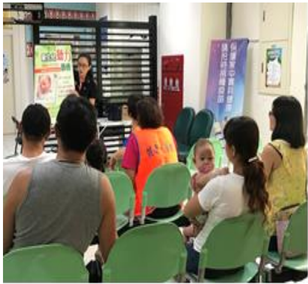
照片內容：107年8月23日於南庄鄉衛生所針對 爸媽及家人 宣導 新生兒聽力篩檢 重要性