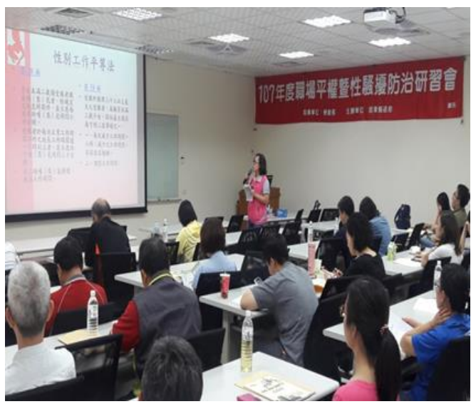
照片內容：107年6月15日配合勞青處於工業會針對 職場管理人員 辦理營造友善職場母乳哺育環境。