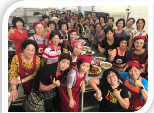
結合農會家政班將蔬果入菜