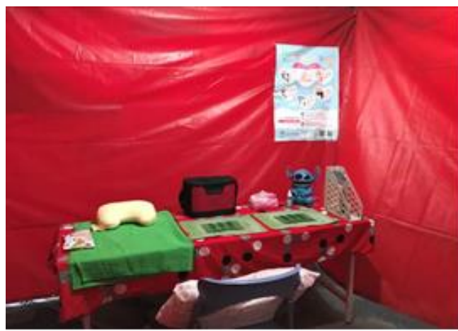
照片內容：臨時哺集乳室提供相關海報、單張、冰桶、延長線、躺椅、U 行枕頭…等等。