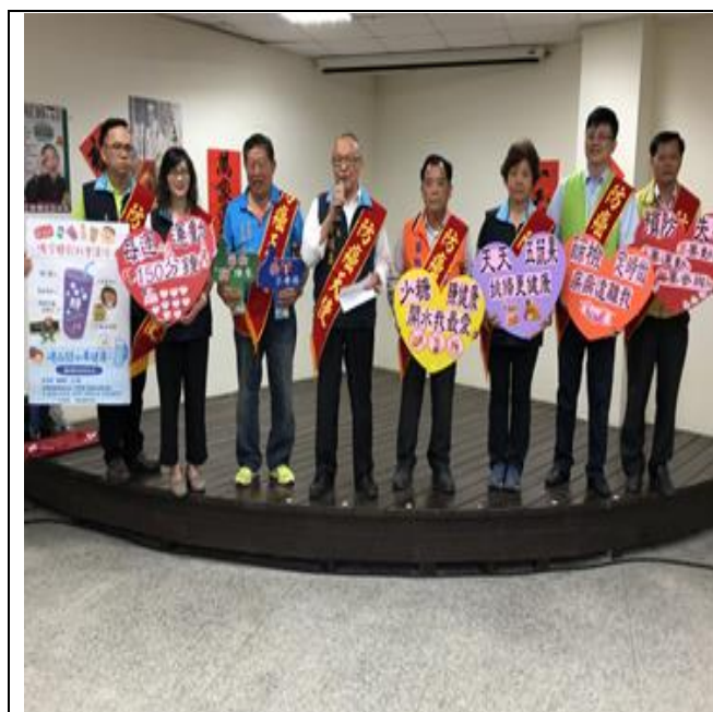
107 年 4 月 20 日西湖鄉大型整合性篩檢活動-苗栗縣徐耀昌縣長代言防癌大使,並主動關懷參與篩檢民眾