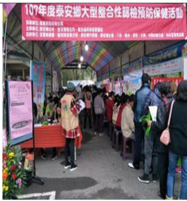
107 年 1 月 20 日至偏鄉地區下鄉設站於泰安鄉公所前廣場為民眾辦理大型整合性篩檢預防保健活動。已健康把關。