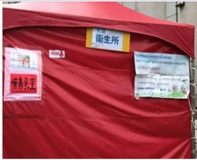
照片內容：臨時哺集乳室，門口張貼標示。