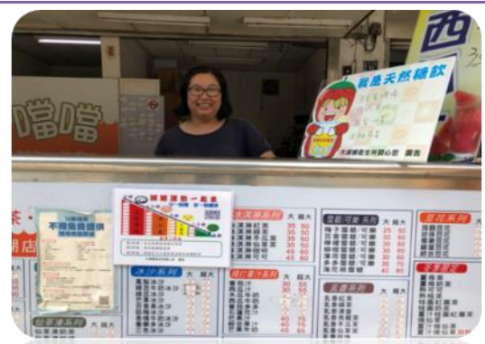
於飲料店張貼減糖宣導立牌，推薦天然 糖飲，減少致胖環境