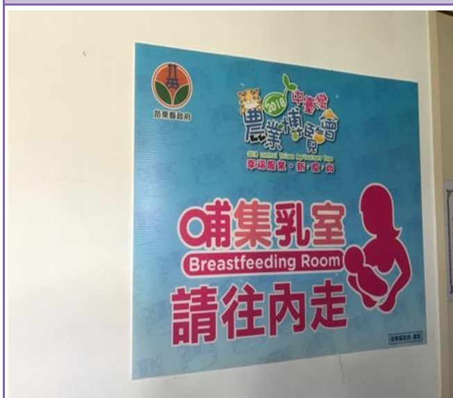
照片內容：指引指標。