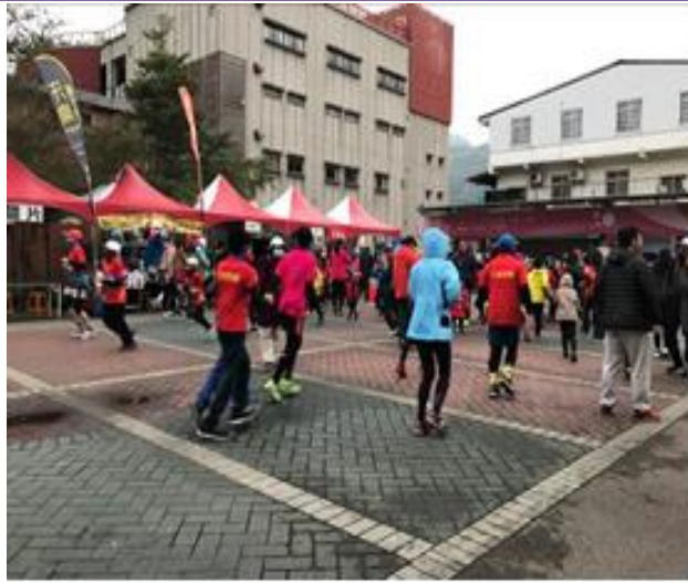
照片內容： 107 年 02 月 03 日於大湖酒莊對面廣場路跑活動，母乳哺育-行動哺集乳室