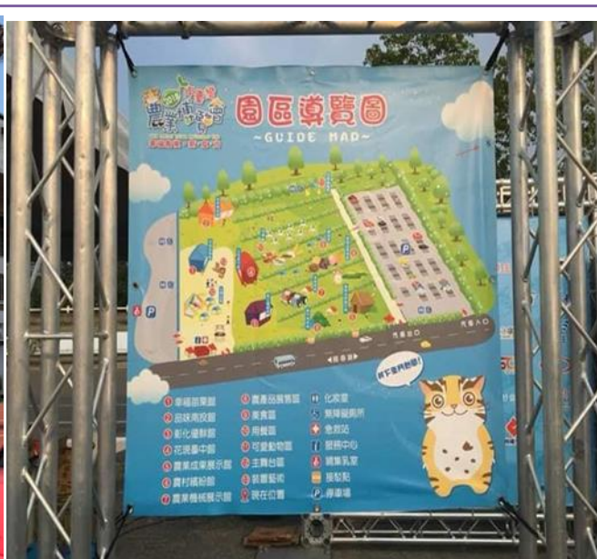
照片內容：107.9.22~10.14，107年中台灣農業博覽會苗栗縣立體育場旁臨時哺集乳室