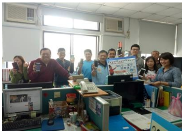
經營動動群組、打氣、鼓勵正面能量。