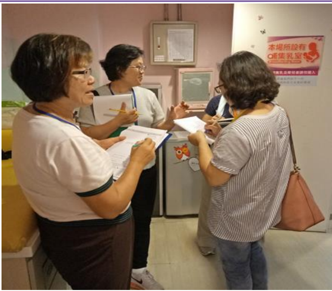
照片內容：107.07.7 日偕同哺集乳室競賽委員至參賽單位(客家文化園區)，進行實地訪查。