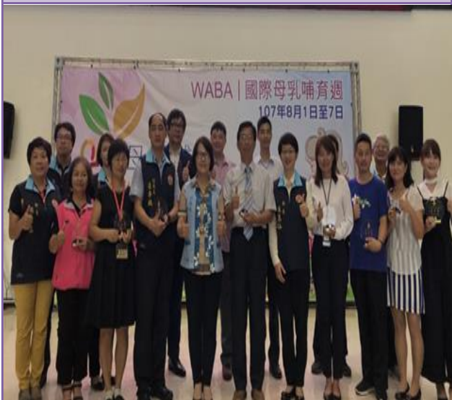
照片內容：107.8.3 於縣府一辦大廳辦理 107 年國際母乳記者會暨優良哺集乳室頒獎活動。