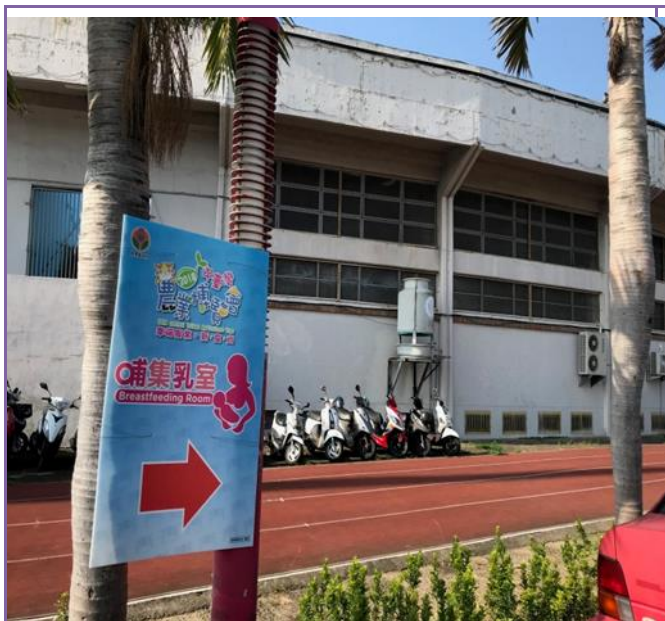
照片內容：指示方向圖