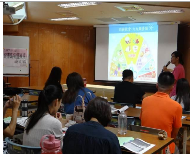
辦理健康職場(臺東場)說明會，聘請營養師提供職場均衡飲食、健康吃知能