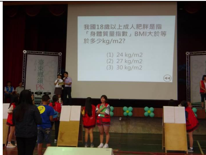
辦理「健康金頭腦PK賽」，將宣導健康議題介入