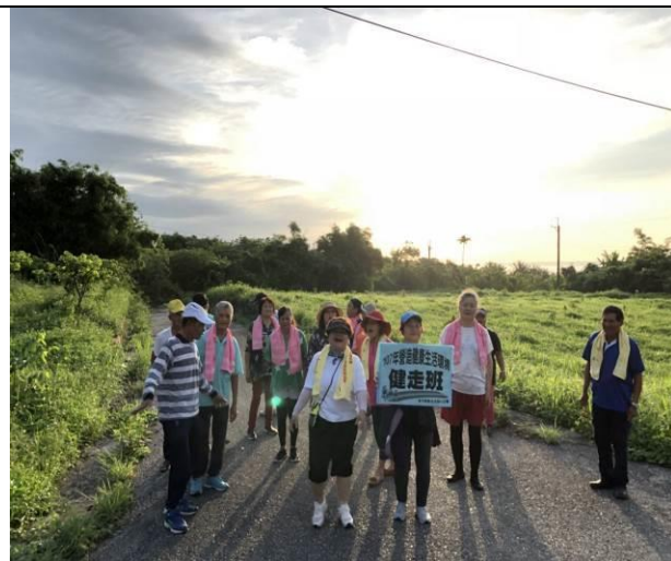
辦理健走班，鼓勵民眾生活化運動