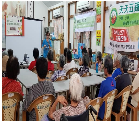
本縣成立 16 個社區營養衛生教育站點