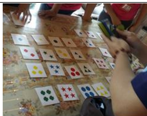
9 月 29 日失智症講座-樂活瑞智人生