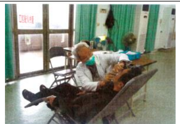
辦理社區篩檢提供口腔黏膜檢查服務。