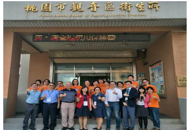
【觀音區衛生所所辦理高齡友善健康照護機構認證實地訪視】