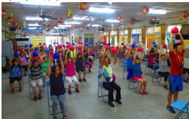
【106年9月25日龍潭區中山社區發展協會-動動健康班】