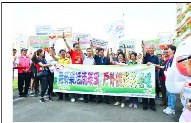
圖 1.為響應「5 月 28 日世界無菸日」，並鼓勵民眾多多出外運動，帶動市內運動風氣，桃園市政府衛生局於 106 年 5 月 20 日(六)在觀音區新坡國小舉辦「觀音健走好元氣，樂活新坡 Be Happy」無菸大型健走活動。