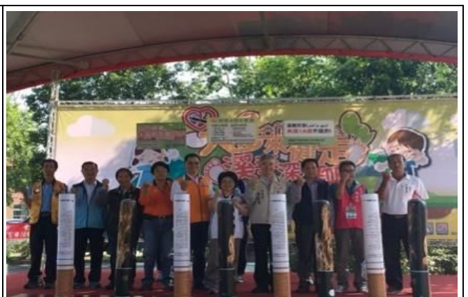
圖 2.106 年 11 月 26 日(日)為增進市內民眾健康體能，增進在地文化認識，於龜山區長庚大學舉辦「甜蜜齊步遠三高，無菸健走好活力」無菸大型健走活動。