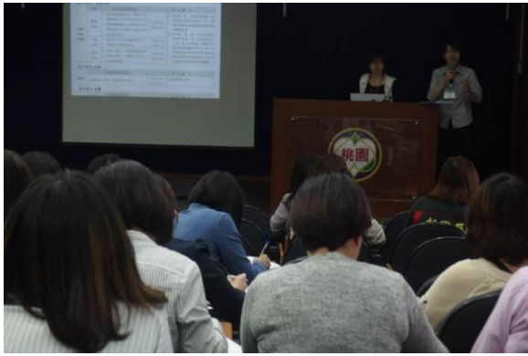
【106年4月5日辦理106年長者衰弱評估表教育訓練】