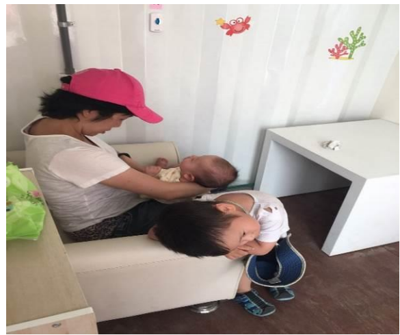
圖 4. 農業博覽會媽媽使用哺集乳室