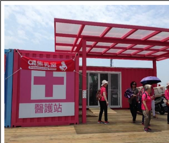
圖 3. 農業博覽會設置哺集乳室(4/22-5/14)