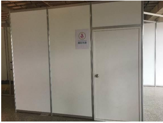
圖 8.地景藝術節設置哺集乳室(8/18-9/3)