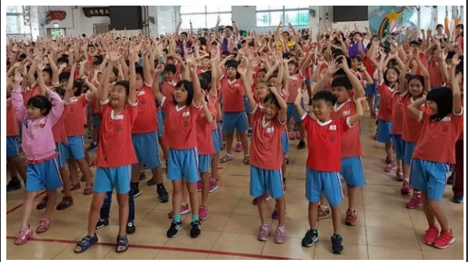
圖 8.加強於校園推廣桃園市健康操。