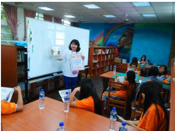
圖 11.校園性教育宣導講座