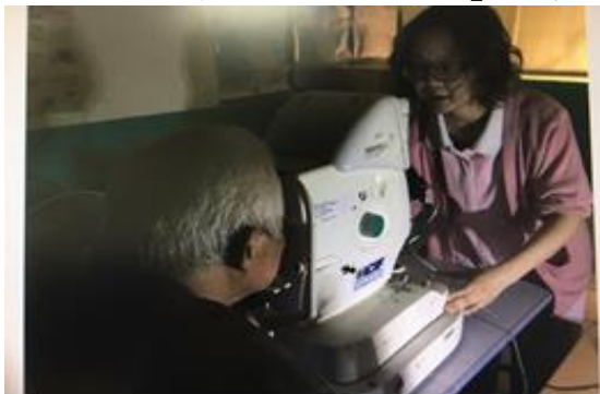
【眼科視篩巡迴服務-眼壓、驗光及眼底鏡檢查】