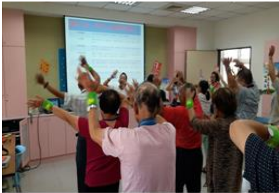
【本市觀音區糖尿病病友會實際運作情形-運動教練帶動「你7了嗎？」健身操】