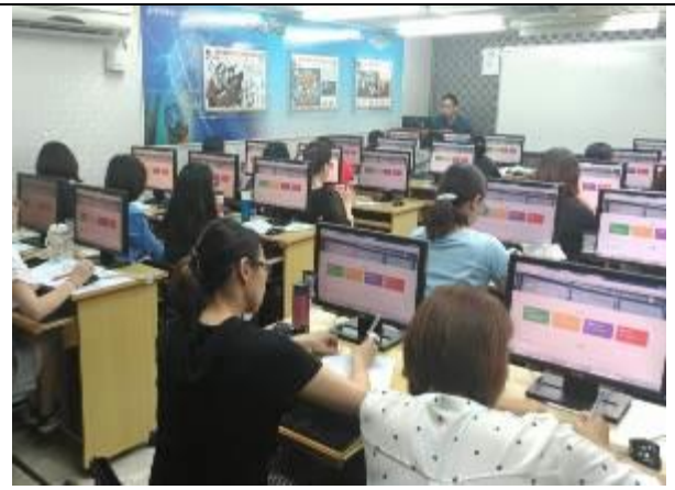
辦理整篩癌篩系統使用者教育訓練。