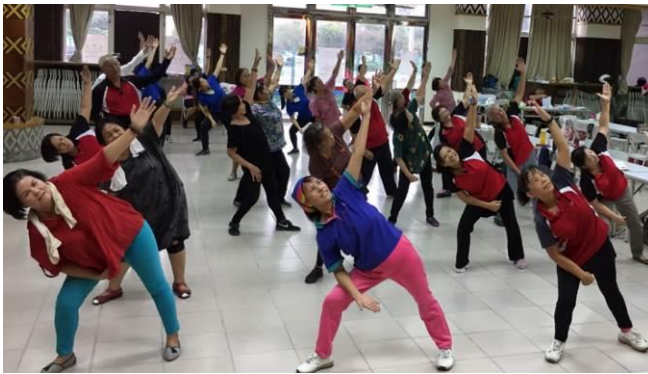
圖 7.持續於 333 健康無菸享瘦站辦理健康體能系列推廣課程。