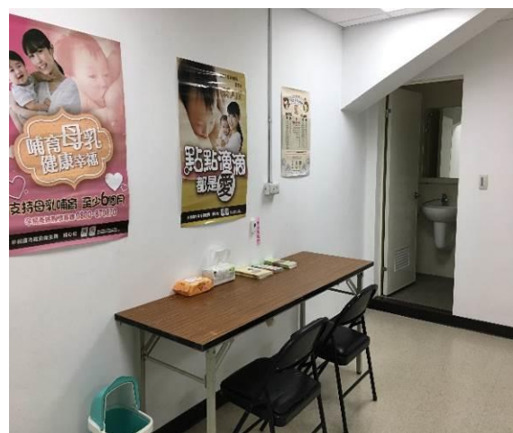
圖 7. 健走活動設置哺集乳室(106年11月26日)