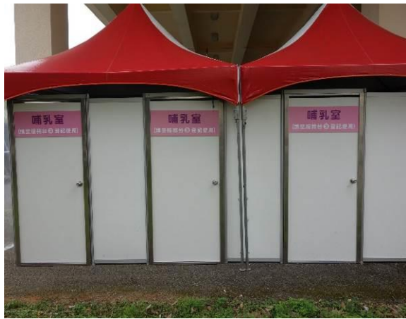
圖 5. 婦幼商品展設置哺集乳室(4/28-5/1)