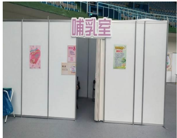
圖 6. 食安博覽會設置哺集乳室(11/2-11/5)