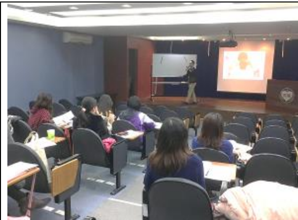
辦理衛生所新進護理人員子宮頸抹片採檢教育訓練。