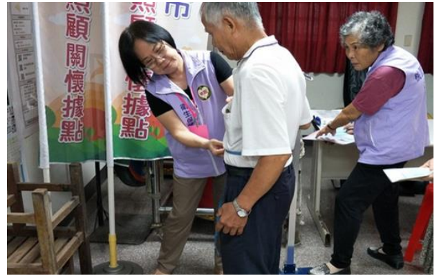
【血壓腰圍健康服務站-志工協助民眾量腰圍】