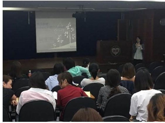
圖 9.於 9 月 6 日辦理新生兒聽力篩檢研習會