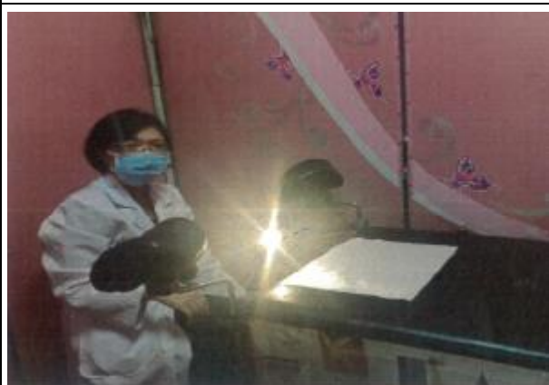
辦理社區篩檢提供子抹採檢服務。