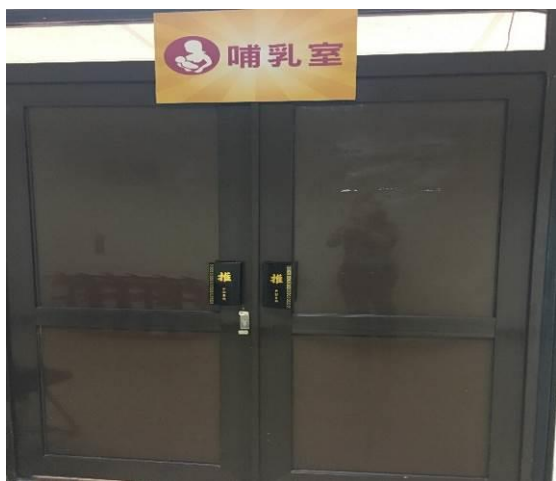
圖 6. 桃園購物節設置哺集乳室 (10/19-10/22)