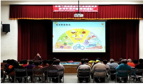
圖 5.社區中衛教宣導民眾健康營養、均衡飲食之重要，提升民眾之知識、態度與技能。