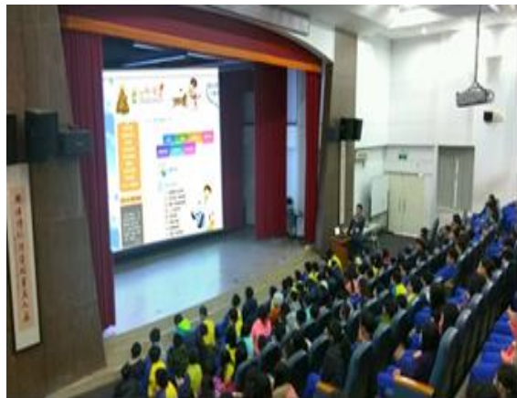
圖 12.校園性教育宣導講座