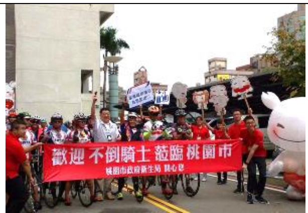
接待台灣抗癌協會辦理之癌友單車環台活動車隊。