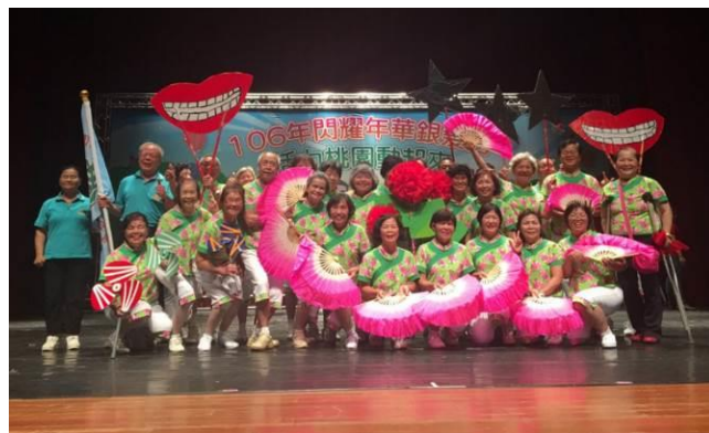
【106年6月20日舉辦106年閃耀年華銀髮秀 活力桃園動起來市內競賽】