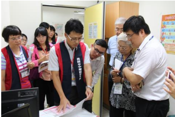
【中壢區衛生所所辦理高齡友善健康照護機構認證實地訪視】