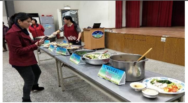
圖 6.社區營養教育示範計畫，辦理營養實作課程，民眾體驗健康料理之製作。