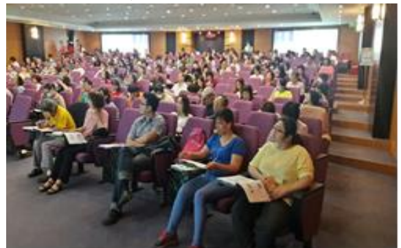
【與壠新醫院合作辦理「慢性腎臟病與糖尿病腎病變繼續教育訓練課程」】