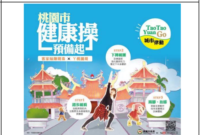
圖 4.本市推出桃園市健康操，以鼓勵市民多多運動，有益身心健康。