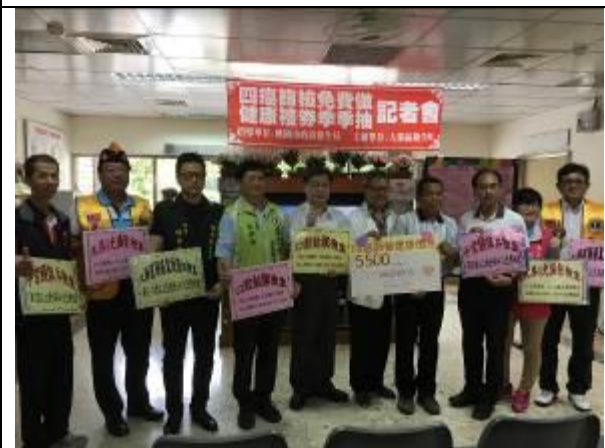
辦理四癌篩檢抽獎活動記者會。