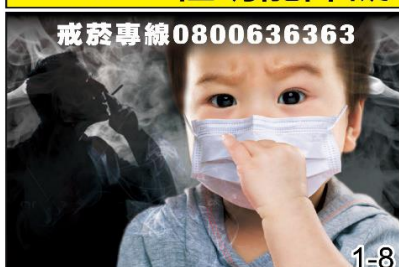
二手菸毒害全家人