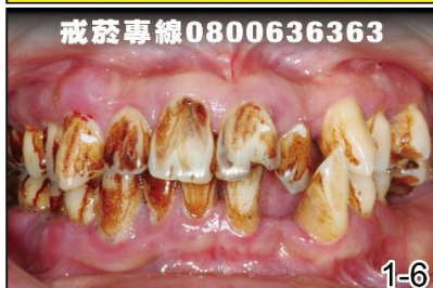
吸菸導致 牙周炎及口臭