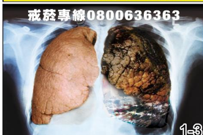
吸菸導致 肺氣腫及肺癌