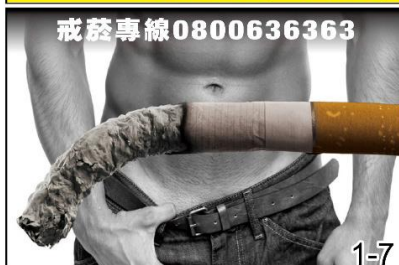
吸菸會造成 性功能障礙