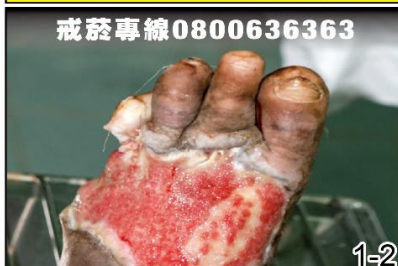
吸菸導致 肢端壞死截肢