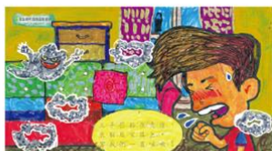
佳作 臺北市復興幼兒園▲陳○學