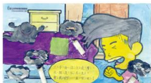
佳作 新北市彩虹島蒙特梭利▲張○容