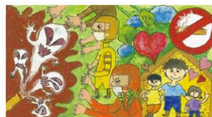
優選 宜蘭縣孝威國小▲林○姪