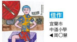
佳作 宜蘭市 中道小學 ▲周○慧