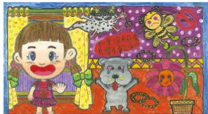
佳作 新竹縣新社國小▲李○藥