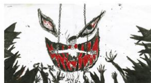
佳作 高雄市中庄國小▲古○命