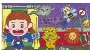
佳作 高雄市潮寮國小▲簡○恩